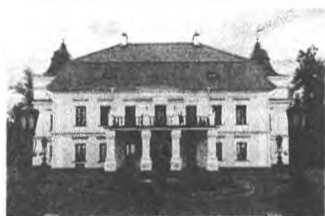
Рисунок 1 – усадьба в настоящее время

Недалеко от города Бреста находится небольшая деревня Скоки. Удивительно то, что в ней сохранилась усадьба XVIII века, принадлежавшая когда-то роду Немцевичей. Усадьба в Скоках имеет мемориальное значение. Здесь жил классик польской литературы эпохи Просвещения, творец национальной идеи Польши, общественный деятель – Юлиан Урсын-Немцевич, один из авторов демократической Конституции от 3 мая 1791 г., участник освободительного движения, сподвижник Тадеуша Костюшко в восстании 1794 г., участник восстания 1830-1831 гг.