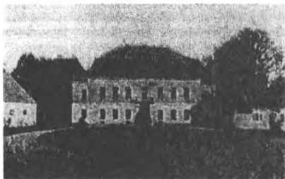
Рисунок 3 – фото 1914 г

Усадебный дом с официной (справа) и конюшней (слева) образовывал парадный двор с традиционным кругом в центре. Судя по фотографии примерно 1914 г., он имел идеальную геометрическую форму. Боковые одноэтажные флигели были с высокими крышами.