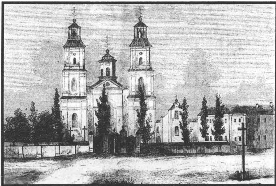
Рисунок 1 – Гравюра XIX века

Настоятелями монастыря были такие легендарные униатские религиозные деятели, как И. Кунцевич и Б. Тарлецкий. Здесь, по привилегии папы римского, была открыта духовная школа, которая дала образование многим священнослужителям униатской церкви. Во время войны 1654–1667 гг. монастырь приютил базилиан всей Речи Посполитой, сохранив в это смутное время чудотворные образы Матери Божьей из Троицкого монастыря в Вильне и Свято-Успенского монастыря в Жировичах [1, с. 151]. В XVII в. Бытеньская обитель считалась самой сильной и богатой в ордене. Основателем монастыря считается слонимский маршале Григорий Тризна, представитель знаменитого рода, придерживающегося униатства. Каменный монастырь был заложен в 1640 г. Возведение соборной каменной церкви игуменом Иосифом Петкевичем датируется концом XVII – началом XVIII в. Различные источники указывают 1673 г. [2, с. 142], 1708–1710 гг. [3, с. 98–99], 1710 или 1711 гг. [4, с. 462]. Существуют и разночтения в названии храма. В белорусской историографии он упоминается как церковь Рождества Богородицы, собор св. Иосифата (1710), Троицкая церковь (1780).