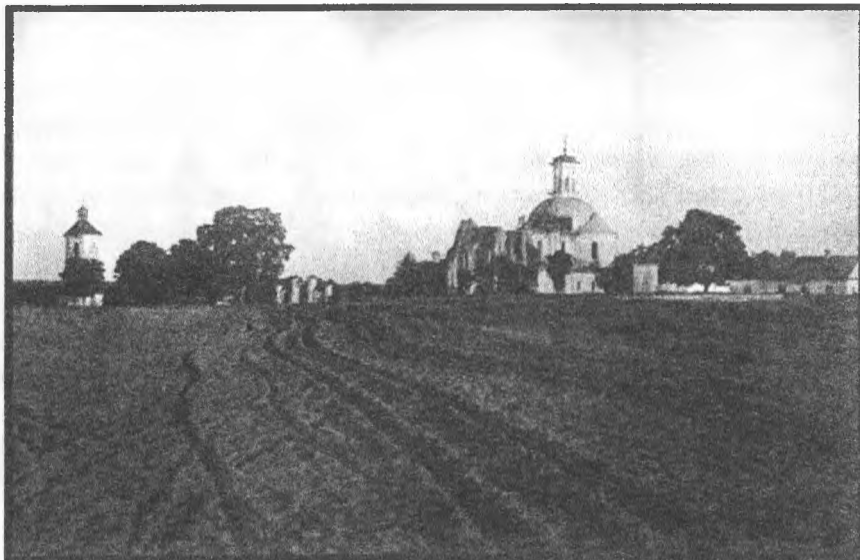
Рисунок 2 – Вид на колокольню, развалины Троицкой церкви и монастырь

Дипломный проект, выполняемый на кафедре «Градостроительство» АФ БНТУ в 2014 г., посвященный реконструкции Бытены, направлен в первую очередь на развитие деревни и возвращении ей статуса поселка. И акцентом реконструкции служит возрождение монастырского комплекса.