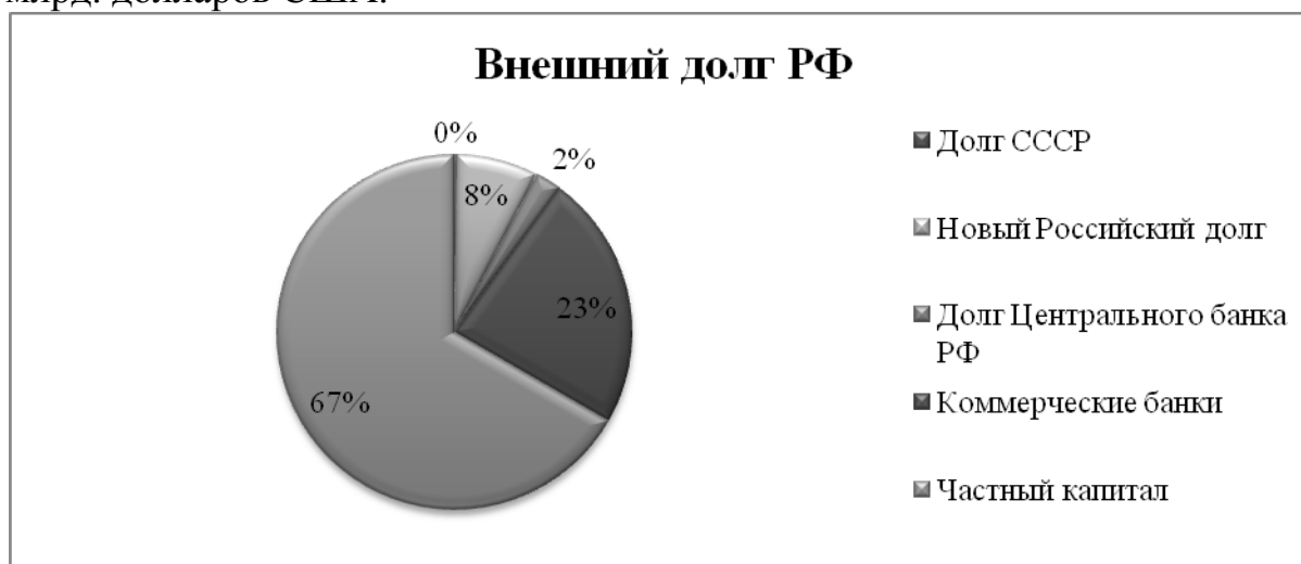
Рис. 3. Структура внешнего долга РФ на 1 января 2017 г. [3].

Таким образом, данные таблицы 2 позволяют сделать вывод, что наибольшая сумма внешних задолженностей приходится на частный капитал и составляет 342 640 млрд. долларов США, а в процентном соотношении имеет наибольшую долю от совокупного внешнего долга – 66,7%. В свою очередь наименьшую долю занимают обязательства СССР – 0,2%, которые в номинальном виде составляют 1 045 млрд. долларов США.