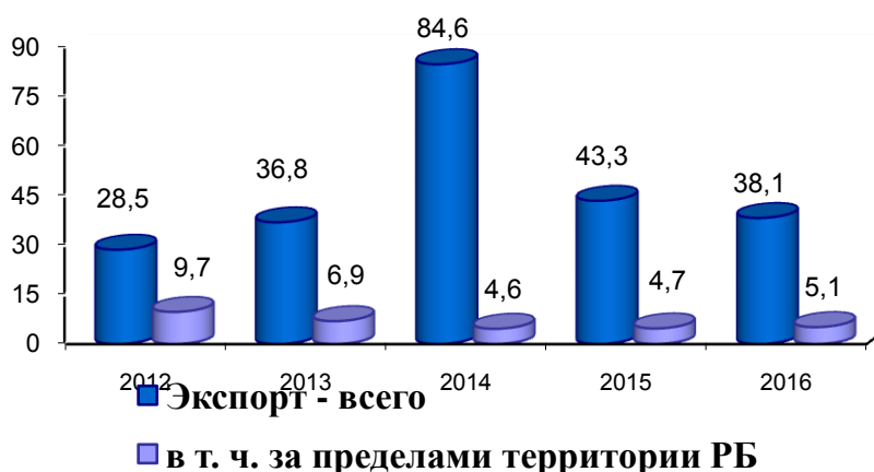
Рисунок 1 – Динамика экспорта строительных услуг по Брестской области за 2012–2016 гг. (млн долл. США).

По итогам работы за 2016 год в целом по области с учетом подрядных организаций республиканской собственности экспорт строительных услуг составил 38,1 млн долл. США (темп роста 87,2%). По объему экспорта строительных услуг область занимает в республике V место; по объему работ, выполненных за пределами республики, — только VI место, всего 1% от всего объема подрядных работ.