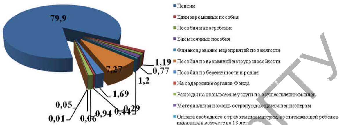
Рисунок 1 – Структура расходов по государственному социальному страхованию Фонда за 2011 год

ных пособий на 0,34 п.п., а также по беременности и родам на 0,14 п.п., единовременные пособия на 0,14 п.п. по сравнению с 2010 годом. В то же время уменьшились расходы за оказываемые услуги по осуществлению выплат и финансирование мероприятий от безработицы и по обеспечению занятости. На рисунке 1 представлена структура расходов по государственному социальному страхованию Фонда за 2011 год.