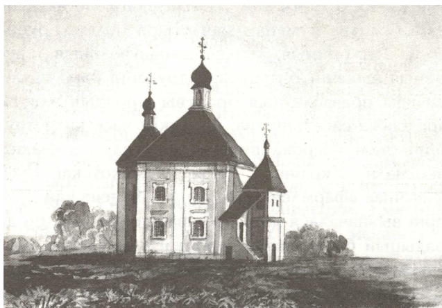
Рисунок 3 – Святодуховская церковь Оршанского Кутейнского монастыря

1664 году. Храм представлял собой внушительное 4-х срубное крестово-купольное здание (около 40 м в высоту). Храм опоясывала невысокая обходная крытая галерея, имеющая несколько входов. Как определяют исследователи, 4 сруба церкви образовывали центральное квадратное в плане помещение. К нему примыкали апсида, два боковых предела и бабинiec с входом. Белорусский историк и археограф протоиерей И.И. Григорович, описывая в 1824 году Кутейнский монастырь, отмечал, что деревянный храм во имя Богоявления Господня и двумя пределами - во имя Архистратига Михаила и Благовещения Пресвятой Богородицы являлся главной церковью Кутейнской лавры. Внутри храма находились портреты основателей монастыря Богдана Статкевича и его жены Анны. Строительство собора осуществлялось с 1623 по 1635 год. В 1639 г. одним из монахов монастыря были расписаны стены внутри храма. Роспись включала 38 многофигурных композиций. Собор был освящен в 1635 году прибывшим из Киева митрополитом Петром Могилой. Уже к его приезду братии в монастыре насчитывалось 200 человек.