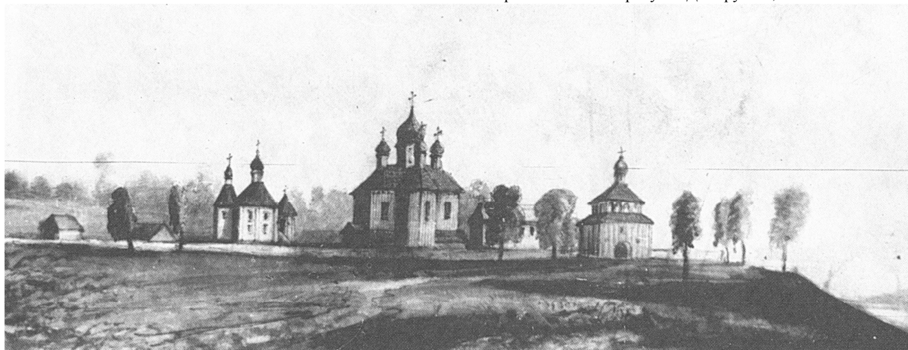
Рисунок 2 – Панорама Оршанского Кутейнского монастыря.

В 1623 году приступили к построению, как монастырских келий, так и деревянного трехпрестольного Богоявленского собора, на каменном фундаменте, с пятью главами, и шестиярусным резным вызолоченным иконостасом – Богоявленского собора. Внешний архитектурный облик Богоявленского собора запечатлен на рисунке Д. Струкова, выполненным в