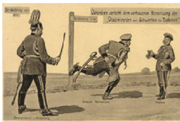
Рис. 3. Николай награждает Ренненкампа «Владимиром с мечами» за смелость при бегстве с поля боя. Германская почтовая открытка

В результате поражений армий А.В. Самсонова и П.К. Ренненкампа российской армии пришлось отступить из Восточной Пруссии. Этому событию посвящена карикатура, показывающая, как генерал П.К. Ренненкамф бежит от генерал-фельдмаршала П. Гинденбурга к Николаю II, который уже готов вручить полководцу орден (рис. 3). Примечательно, что германское командование считало, что именно П.К. Ренненкамф был одним из главных виновников неудач российской армии в Восточной Пруссии.