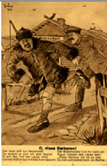
Рис. 5. О, эти варвары. Германская почтовая открытка

Следующая группа карикатур была направлена против Антанты, и здесь вызывает интерес трактовка образа России в этом Союзе. В советские годы нередко отмечали, что Россия в Первой мировой войне не действовала самостоятельно. Подчеркивалось, что задачи и действия царских войск на российско-германском фронте всецело зависели от мнения западных союзников. Однако в немецких карикатурах подобное мнение встречается редко. Лишь в нескольких карикатурах Россия представлена с мешками денег, полученных от Франции и Англии для продолжения войны с Германией. В большинстве случаев Россия показана как равноправный участник Союза, которому наравне с союзниками «достаётся» от немецких войск. На одном из плакатов немецкой армии противопоставлялись страны Антанты, над которыми нависли архангелы, которые укоризненно взирают на Россию и её союзниц; при этом Россию называют «зачинщицей войны». Другая карикатура показывает, как страны Антанты стоят по стойке смирно перед немецким солдатом, а возглавляет шеренгу российский солдат. Шеренга сопровождается надписью «Банда грабителей». На другой карикатуре немецкий солдат ведет пленных солдат стран Антанты. И снова во главе колонны идет Россия.