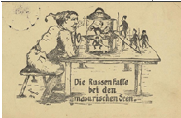
Рис. 2. Происшествие с русскими у Мазурских островов. Германская почтовая открытка

В результате поражений армий А.В. Самсонова и П.К. Ренненкампа российской армии пришлось отступить из Восточной Пруссии. Этому событию посвящена карикатура, показывающая, как генерал П.К. Ренненкамф бежит от генерал-фельдмаршала П. Гинденбурга к Николаю II, который уже готов вручить полководцу орден (рис. 3). Примечательно, что германское командование считало, что именно П.К. Ренненкамф был одним из главных виновников неудач российской армии в Восточной Пруссии.