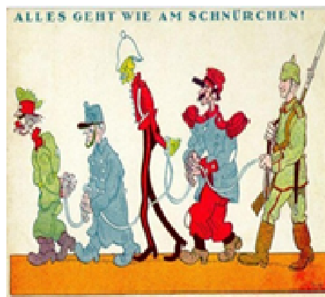
Рис. 7. Всё идет как по маслу. Германская почтовая открытка

Распространены были карикатуры, изображавшие колонну пленных стран-союзниц по Антанте. На одной из таких карикатур во главе колонны шла Россия. Изображение сопровождалось надписью: «Всё идет как по маслу» (рис. 7).