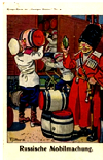
Рис. 4. Русская мобилизация. Германская почтовая открытка

Однако, несмотря на агитацию со стороны государства, германские командующие и солдаты высказывались о российской армии не только в негативном свете. В воспоминаниях германских военных можно встретить немало позитивных оценок способностей своих противников на Востоке.