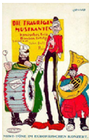
Рис. 6. Печальная музыка Антанты. Германская почтовая открытка

На одной из карикатур Россия, Франция и Англия были представлены в виде музыкантов. Российский солдат с перевязанной головой играл на порванном барабане. По сути, все страны Антанты показывались равноправными участниками «оркестра» (рис. 6).