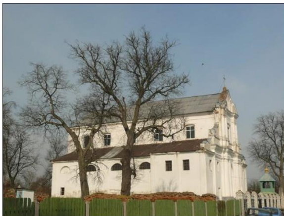
Рисунок 7 – Внешний вид церкви

Костёл в 1866 году приспособлен под православную Крестовоздвиженскую церковь. До 2011 года она была заброшена. В настоящее время храм действующий, находится в состоянии реконструкции проводимой за счёт приходских пожертвований, является архитектурным памятником республиканского значения.