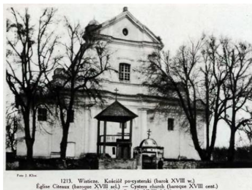
Рисунок 5 – Свято-Крестовоздвиженская церковь (не позднее 1930 г.)