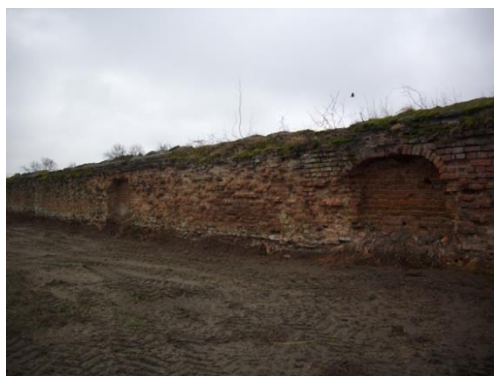
Рисунок 4 – Стены разрушенного монастыря

Боковые фасады обработаны двойными пилястрами, окна окружены полуциркульными архивольтами. Стены основного объёма расчленены окнами и плавно переходят в глухую стену мощной апсиды. В центре её