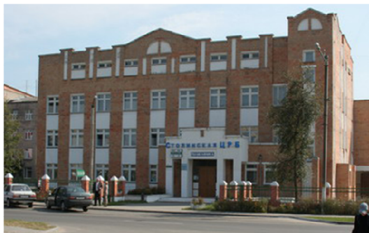
Рисунок 3. Здание поликлиники в г. Столине

В 1984 году в районе решили возродить обряд празднования окончания уборки урожая – дожинки. Тогда этот праздник назывался Полесский кирмаш, он до сих пор проводится в Столине. Именно на этих осенних ярмарках в Столине и был фактически создан сценарий современных «Дожинок». По сравнению с нынешней пышностью и помпезностью первые республиканские «Дожинки» прошли очень скромно. Местные жители с трудом вспоминают, что и где было отремонтировано к тому событию.