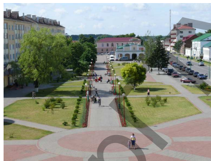
Рисунок 5. Благоустройство площади в г. Пружаны