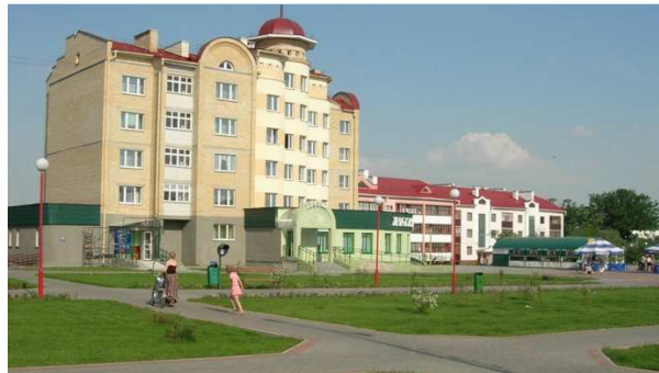
Рисунок 4. Жилой дом в г. Пружаны

2. Пружаны – город с населением 19,3 тыс. чел. Первые косвенные упоминания о населенном пункте можно найти в исторических документах 1433 года. Город известен с 1487 года как Добучин. Современное название закреплено в 1589 году. Промышленность Пружан представлена предприятиями, перерабатывающими сельскохозяйственное сырьё, заводом радиодеталей, комбинатом строительных материалов, лесхозом, имеющим свою производственную базу, и другими предприятиями.