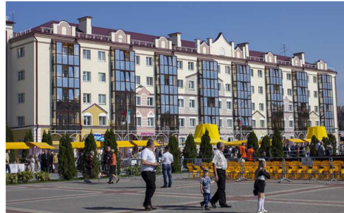
Рисунок 7. Жилой дом в г. Пинске