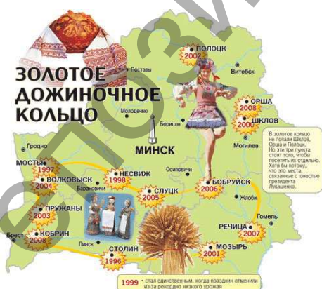
Рисунок 1. Золотое дожиночное кольцо Беларуси 1996 – Столин; 2003 – Пружаны; 2009 – Кобрин; 2014 – Пинск

Этот древний обряд известен практически всем народам, которые занимаются земледелием. С давних времен «Дожинки» означали конец жатвы, горячей уборочной поры и тяжелой работы, поэтому и праздновали его всегда с размахом.