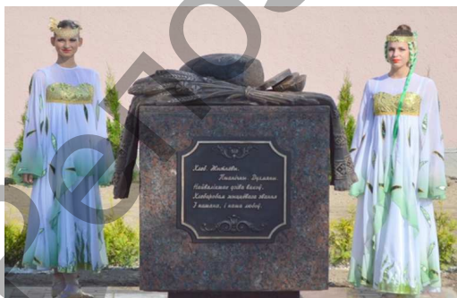
Рисунок 8. Памятник хлебу

Одним из знаковых событий праздника урожая стало открытие в Пинске памятника хлебу.