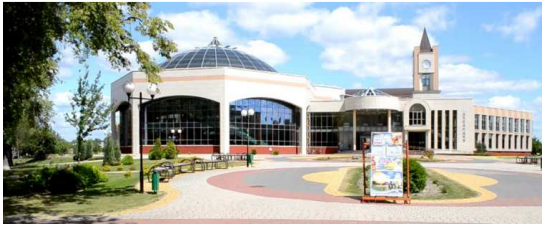
Рисунок 6. Аквапарк в Кобрине. Кобринских “Дожинок”