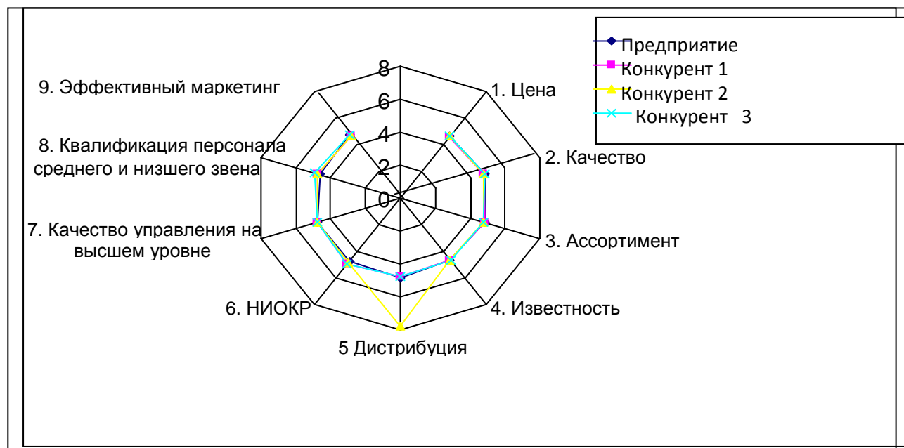
Рисунок 3.1 – Профиль конкурентоспособности предприятия

Далее набор показателей конкурентоспособности может быть обработан с использованием многоугольника конкурентоспособности по ряду показателей (от 5 до 10 показателей). Возможно использовать те же параметры или представить дополнительный набор: цена, качество, ассортимент, известность, дистрибуция и т. д. – список следует подвергнуть оценке так же при помощи мнения экспертов, используя анкету или интервью. Результаты оценки – среднее арифметическое суммированных оценок экспертов (например, от 0 до 8) представить в виде многоугольника конкурентоспособности (см рисунок 3.1).