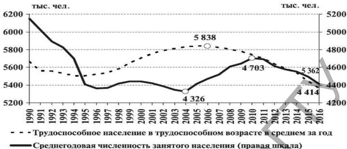
Рисунок 1 – Численность занятого населения, тыс. чел.

3. В настоящее время на рынке труда страны наблюдаются положительные тенденции, которые характеризуются снижением уровня зарегистрированной безработицы и ростом спроса на рабочую силу, что представлено на рисунке 2. Уровень зарегистрированной безработицы снижается и в 2017 г. составил 0,6 % к численности экономически активного населения. Снижение уровня безработицы произошло в указанный период за счет сокращения более чем на 32 % количества граждан, состоящих на учете в органах по труду, занятости и социальной защите населения [4, С.35]. Стабилизации состояния рынка труда способствовал значительный рост числа вакансий, заявленных нанимателями в 2017 г. В результате позитивных тенденций численности официально зарегистрированных безработных и числа вакансий, коэффициент напряженности на рынке труда составил 0,5 безработных на одну вакансию [2].