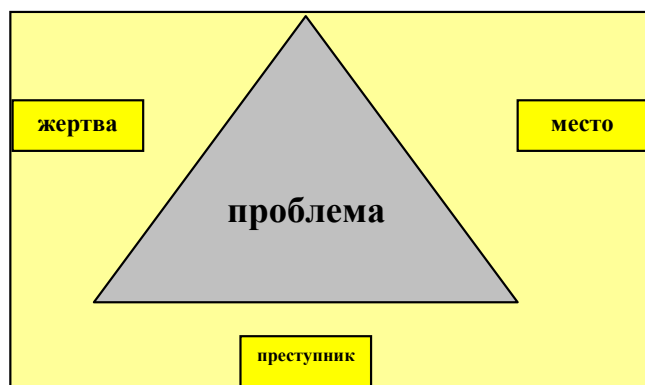
Рис. 1. Треугольник преступности

В рамках Альтернативной Стратегии Чикагской Полиции предлагается методика решения проблем, которая включает пять шагов. Во-первых – определение проблемы и придание ей ключевого значения. Во-вторых – анализ проблемы, согласно механизму, названному «треугольником преступности» [6] (рис. 1).