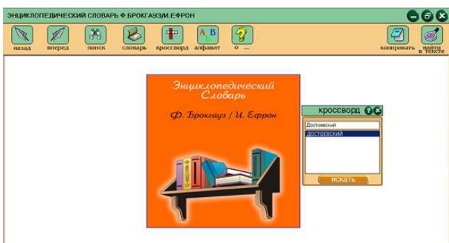
Мал. 1. Адкрыцце артыкулаў "Малого энцыклапедычнага слоўніка" Бракгауза-Эфрона

Матэрыял у "Малым энцыклапедычным слоўніку" Бракгауза-Эфрона падаецца па правілах арфаграфіі і стылістыкі сучаснай рускай мовы, чым прыемна адрозніваецца ад ужо вядомага на рынку дарэвалуючайнага "Толкового словаря живого великорусского словаря" У.Даля (1997 г.). Але, здаецца, не бывае плюсаў без мінусаў. Калі ў адсканаваным па кніжных разваротах слоўніку Даля можна было спасылца на старонку кніжнага выдання, то ў камп'ютарным Бракгаузе, на жаль, такой інфармацыі не ўтрымліваецца, нават не пададзены год выдання арыгіналу. Зрэштам, практычна ўсе электронныя публікацыі "губляюць" старонкі цвёрдых арыгіналаў (за выняткам зробленых у фармаце .pdf). Здаецца, існуе адзінае выйсце – падаваць замест старонкі ў дужках назву слоўнікавага артыкула пасля выхадных дадзеных CD.