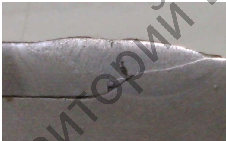
Рисунок 3 – Сварной шов в разрезе

Была проведена практическая работа, заключающаяся в выявлении дефектов разработанным ультразвуковым пьезоэлектрическим преобразователем и сравнение полученных результатов с дефектами, выявленными при вскрытии. Настройку браковочного уровня чувствительности производили по зарубке размером 2,0*0,5 мм. Получены предварительные результаты (рис. 3). На рисунке виден выявленный непровар.