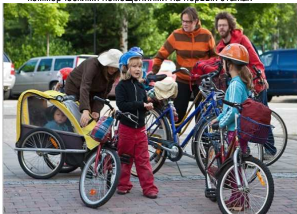
Рис. 2. Формирование улично-дорожной сети с организацией велосипедного движения