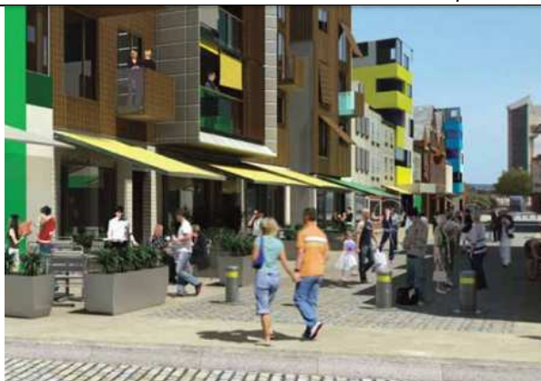
Рис. 1. Формирование общественных пространств. Жилые здания с коммерческими помещениями на первых этажах