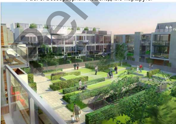
Рис. 4. Безопасные дворовые территории. Озелененные благоустроенные территории составляют не менее 40 процентов