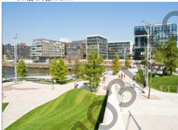
Рис. 3. Безбарьерные пешеходные маршруты