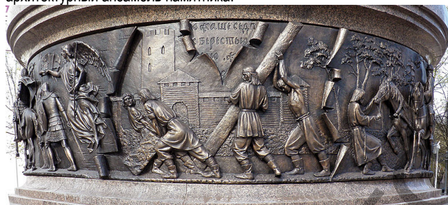
Рис. 3. Фрагмент скульптурной композиции посвященной 1000-летию г. Бреста

По окружности, под скульптурами, внизу колонны в апреле 2011 года был установлен круговой горельеф общей площадью 11 м 2 . На нём изображены наиболее значимые для истории Бреста ключевые события. «Ехал купец, да застрял в болоте. Он и его слуги уложили гать из бересты» и таким образом спаслись: отсюда по одной из легенд пошло название Берестье. Далее изображены фрагменты исторической Грюнвальдской битвы 1410 года. Вот небесные силы в образе Ангела, благословляющие на победу воинов берестейской хоругви. Один воин держит в руках стяг с гербом берестейского воеводства – «Погоня», на щите другого – лук с направленной вверх стрелой – герб Бреста. Далее – сцены битвы соединенных полков ВКЛ и Польши с тевтонцами, тщательно пластически выверенные во всех исторических ракурсах, реалиях, атрибутах и аксессуарах. Рядом – Брестская Библия в руках ангелов над древним городом. Не забыта и героическая оборона Брестской крепости, вошедшая в легенду мировой истории войн. А заканчивается этот пояс темой освоения Космоса. Это и понятно: уроженец деревни Комаровка Брестского района белорус Пётр Климук трижды побывал в космическом полёте. А на самом нижнем ярусе монумента расположены 12 бронзовых табличек – символических часов, отмеряющих поступь неумолимого времени. На табличках – краткие аннотации о главных событиях многовековой истории города. Летом 2011 года красочная ограда в стиле модерн завершила архитектурный ансамбль памятника.