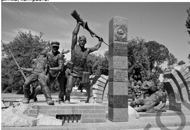
Рис. 1. Памятник героям-пограничникам в Брестской крепости

К главным выразительным средствам скульптуры относятся расположение фигуры в пространстве, ее поза, жесты, передача движения, организация объема, сочетание частей, выбор пропорций, силуэта. Объемная скульптура находится в реальном пространстве и строится по законам гармонии формы и содержания, равновесия, ритма, контраста.