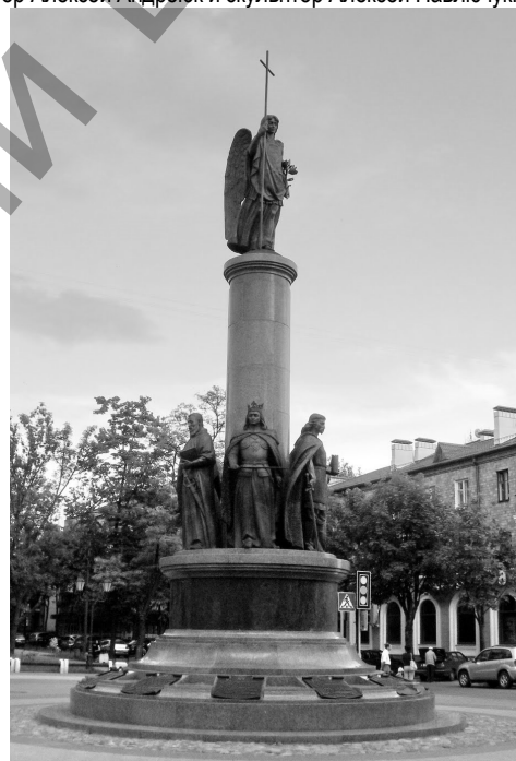
Рис. 2. Памятник 1000-летию г. Бреста