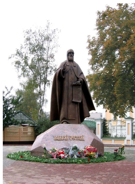
Рис. 6. Памятник Афанасию Брестскому

Среди городов современной Беларуси Брест первый получил магдебургское право. Его даровал король польский и великий князь Литовский Ягайло в 1390 году. Это означало получение Брестом определенной самостоятельности в экономической деятельности, разрешении имущественных споров, регулировании общественно-