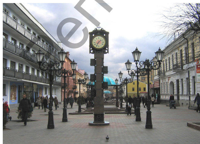
Рис. 4. Декоративные часы г. Бреста

На обновлённой пешеходной улице Советской появились скульптурные композиции, также связанные с историей древнего города. Одна из летописей гласит, что в XVI веке на одной из башен замка были установлены городские часы. А при часах городской магистрат содержал трубоча. Звуки его инструмента сопровождали каждый час.