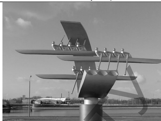
Рис. 9. Скульптурная композиция «Лодки».