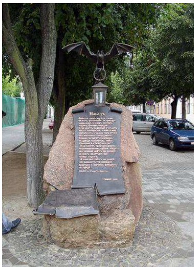
Рис. 7. Скульптурная композиция «Старый фонарь»

На улице Советской «живёт» еще один интересный персонаж – летучая мышь. Она сторожит «Наказ». На свитке написано, что фонарям постановляется гореть всегда и в любую погоду. Идея скульптурной композиции «Старый фонарь» принадлежит брестскому скульптору Алексею Павлючуку, автору монументальной скульптурной композиции, посвящённой 1000-летию основания города.