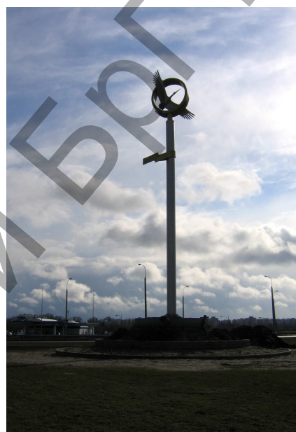
Рис. 10. Скульптурная архитектурно-декоративная форма «К солнцу»

Современная монументальная скульптура создается для конкретного пространственного окружения и может быть вписана как в городской, так и в природный пейзаж. Такое произведение создается не для кабинета одного конкретного человека, а для массового зрителя.