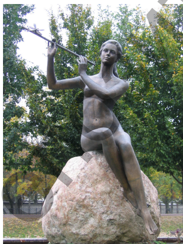
Рис. 8. Парковая скульптура «Мелодия»

В середине одного из озёр парка расположен небольшой островок, который украсила бронзовая скульптура «Мелодия» (по народному «Русалка») – обнажённая фигура девушки, играющей на флейте.