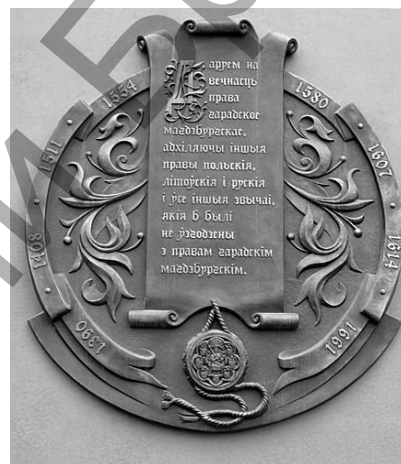
Рис. 5. Памятный знак «Магдебургское право»