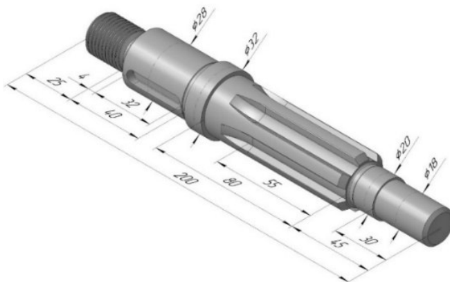
Рисунок 2. Образец индивидуального задания

вала по заданному наглядному изображению. Пример индивидуального задания представлен на рисунке 2.