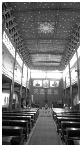
Рисунок 3 – Храм Дали, молитвенный зал и алтарь

За притвором находится трехнефный молитвенный зал, в нем круглые колонны и пере-