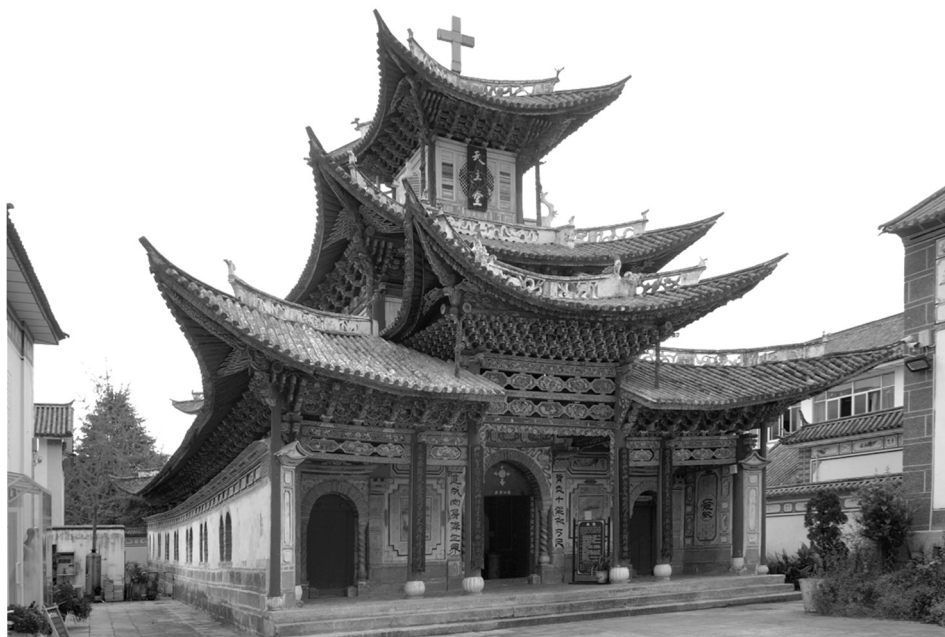
Рисунок 1 – Католический храм Дали

Фасад храма выполнен в традиционном байском стиле с активными карнизами, по центру фасада и с обеих его сторон входные двери. Колонны, поддерживающие карнизы на главном фасаде, двери красные и голубые, как цвет резного карниза и окрашенных стен. На колоннах по сторонам дверей развешены изречения: толкования Евангелия и восхваления народа Дали, местных национальных особенностей. Балки, колонны и другие конструктивные части здания покрыты росписями на темы китайских народных сказок, природных пейзажей, цветов, птиц и растений, но также и западных «библейских» историй, орнаментов западного стиля. Использование этих текстов и рисунков ощущается стремление к органичной интеграции китайской и западной культуры.