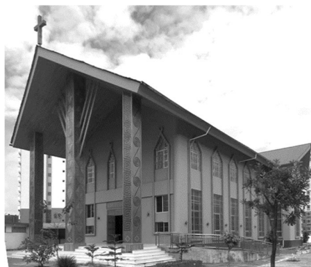
Рисунок 7 – Храм Цзинпо

Сравнение этих трех храмов показывает, что храм народа Дали фокусируется на использовании традиционных строительных материалов, строительных технологий, с локализованными элементами для замены на элементы традиционного храма. Этот храм легко сравнить с традиционным буддийским храмом, хотя каждая часть имеет и отличия. Элементы китайской философии натурализма, содержащейся в китайской архитектуре, также отражаются в этом храме, придавая ему более глубокую культурную коннотацию для людей, думающих о вере, чтобы открыть для себя новые пути. Храм Цичжун демонстрирует структуру европейского готического культового сооружения, украшенного сюжетами и элементами местной тибетской архитектуры и увенчанного формой китайской архитектуры – четырехугольным павильоном с выразительными карнизами. Католический храм народа Цзинпо моложе этих храмов на 100 лет, заметно использование приемов промышленного строительства, но использование элементов и сюжетов декоративно-прикладного искусства с открытым отношением к местной национальной культуре смягчает впечатление о католицизме в глазах общественности. Но каждый из этих храмов характеризует творческое решение, предложенное проектировщиками, строителями и художниками для разрешения культурных и конфессиональных конфликтов. Это позволило в новом храмовом строительстве на юго-западе Китая использовать местные строительные материалы, формы и элементы традиционных архитектурных стилей разных народностей.