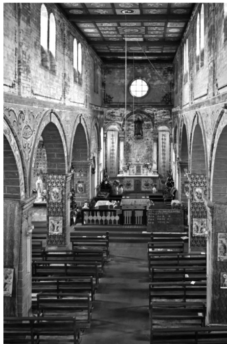
Рисунок 5 – Храм Цичжун, молитвенный зал

Чтобы избежать возможного конфликта с местными религиями и привлечь местное население к католицизму, восстановленный храм Цичжун использует в своей архитектуре и убранстве большое количество традиционных элементов культуры народов Тибета, Бай и Наси. Например, планировочные связи зала храма с боковыми вспомогательными помещениями имитируют скоμμуникации в домах в стиле дворов народа Бай. Было упрощено оформление фасада храма, отказавшись от готического остроконечного шпиля арки, колокольню завершили деревянным павильоном с активными карнизами и шатром крыши. Большинство декоративных оформлений интерьере храма не только французские, – это и тибетские буддийские узоры, с использованием традиционных сюжетов: рыбы, аквариумы и улитки. Росписи тушью в интерьере на стенах ориентированы на стиль традиционной китайской пейзажной живописи,