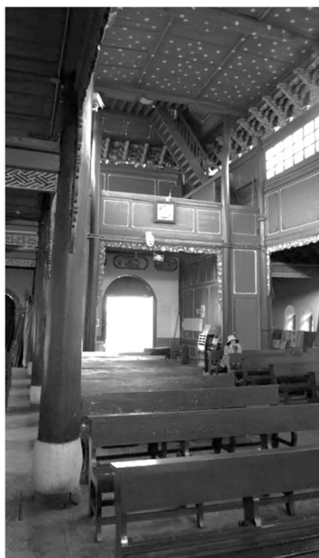
Рисунок 2 – Храм Дали, молитвенный зал и хоры

Фасад храма выполнен в традиционном байском стиле с активными карнизами, по центру фасада и с обеих его сторон входные двери. Колонны, поддерживающие карнизы на главном фасаде, двери красные и голубые, как цвет резного карниза и окрашенных стен. На колоннах по сторонам дверей развешены изречения: толкования Евангелия и восхваления народа Дали, местных национальных особенностей. Балки, колонны и другие конструктивные части здания покрыты росписями на темы китайских народных сказок, природных пейзажей, цветов, птиц и растений, но также и западных «библейских» историй, орнаментов западного стиля. Использование этих текстов и рисунков ощущается стремление к органичной интеграции китайской и западной культуры.