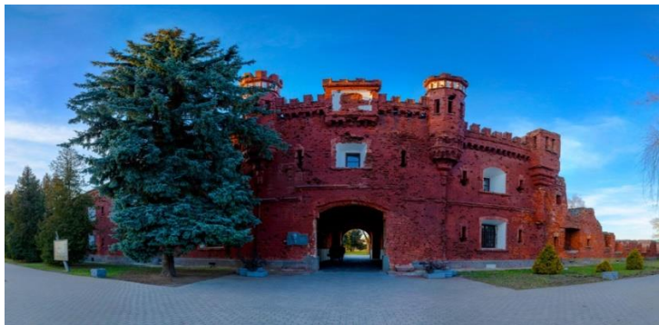
Рисунок 1 – Брестская крепость

Крепость находится в черте города на границе с Польшей. После Ноябрьского восстания 1830-1831 годов перед правительством Российской Империи остро стал вопрос о необходимости создания форпоста на западных границах империи, чтобы усмирить национально-освободительное движение на землях бывшей Речи Посполитой. Так было принято решение о строительстве крепости 1 класса в городе Бресте. Старый город был разрушен до основания и на его обломках в 1833 году началось строительство крепости. В 1842 году основные строительные работы были завершены.