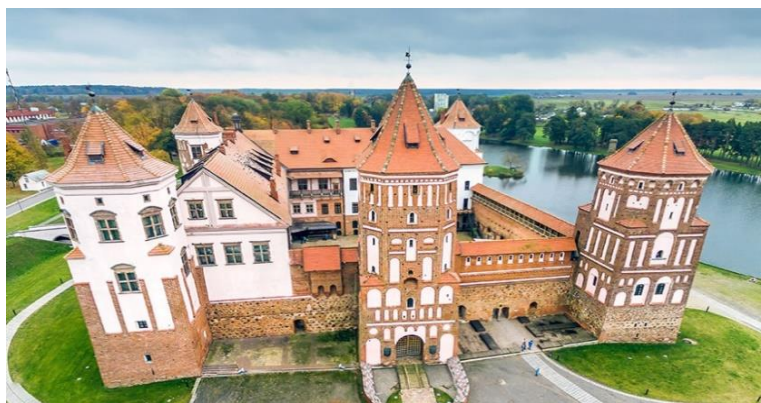
Рисунок 3 – Мирский замок

Замково-парковый комплекс «Мир» является выдающимся памятником готической архитектуры XVI века, включен с 2000 года в список Всемирного наследия ЮНЕСКО.