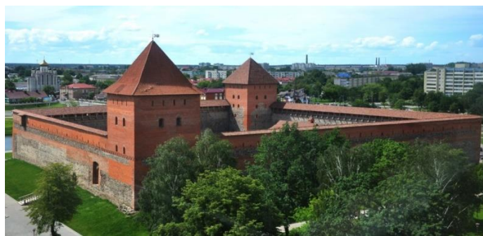
Рисунок 4 – Лидский замок

Лидский замок был построен в 1323 году в городе Лида по поручению князя ВКЛ Гедимина. Основной причиной строительства замка была нестихающая угроза со стороны крестоносцев. Так Лидский замок стал опорной точкой в линии защиты против прибалтийских врагов. На протяжении последующих столетий многократно подвергался осадам, разрушению и разграблению. Только в 20-х годах XX века начались первые реставрационные работы. В 1983 году реставрационные работы продолжились, закончившись в начале 2000-х годов. Ежегодно замок посещают до 100 тысяч туристов.