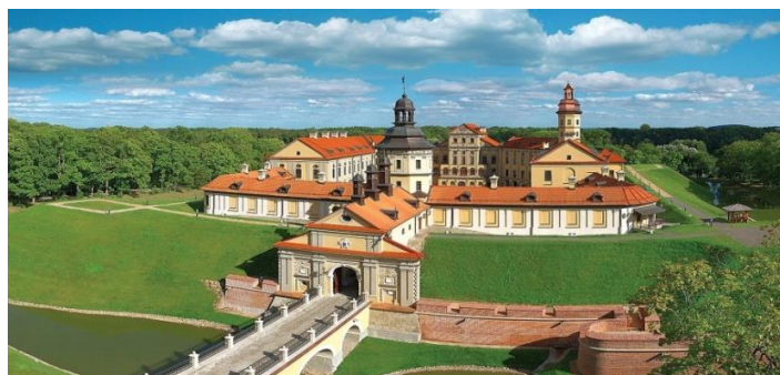
Рисунок 5 – Несвижский замок

Дворцово-замковый комплекс является памятником архитектуры XVI-XVIII веков. С 2005 года замок был включен в список Всемирного наследия ЮНЕСКО. Строительство началось в 1583 году Радзивиллом Сироткой. Архитектурный стиль: барокко. Во время русско-польской войны 1654-1667 гг. замок подвергался штурму, однако осаду выдержал. В дальнейшем замок участвовал в разных военных конфликтах. С середины 2000-х годов был проведен ряд реконструкционных и реставрационных работ. Ежегодно дворцово-замковый комплекс принимает более 400 тысяч посетителей.