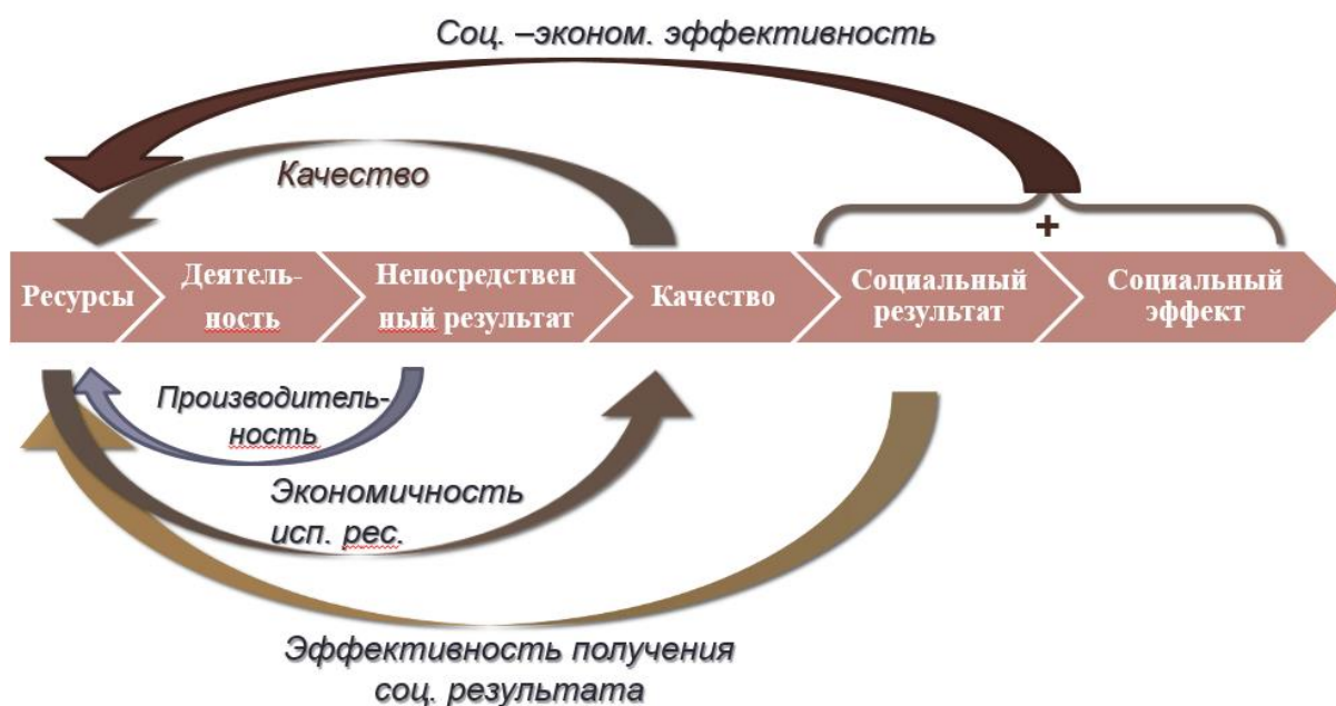
Рисунок 2 – Показатели эффективности социальных предприятий

В основе данных стадий планирования проекта стоят ресурсы, затем выбор деятельности проекта, далее необходим выбор товара или услуги для решения социальной проблемы, то есть непосредственный результат. Затем следует социальный результат, который отражает изменения людей от использования данного товара либо услуги. И завершает эту цепочку социальное воздействие. На рисунке 2 можно заметить показатели эффективности социальных предприятий, которые показывают, что на разных стадиях производства и реализации можно оценить различный показатель эффективности деятельности.