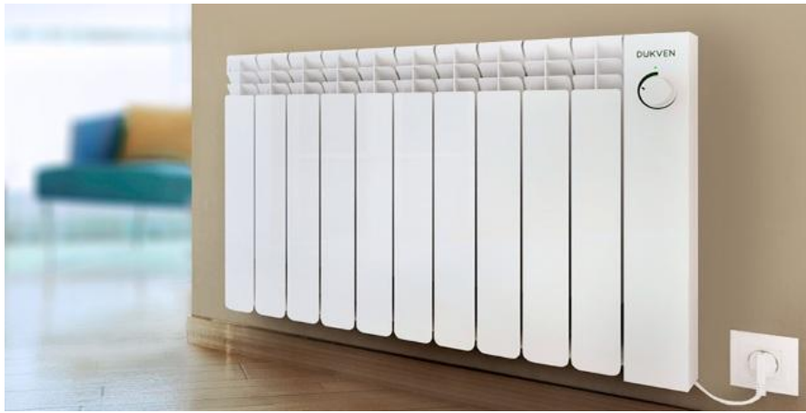
Рисунок 1 – Электрический радиатор отопления

Расчёт денежных затрат на отопление за один отопительный сезон произведём по двум тарифам.