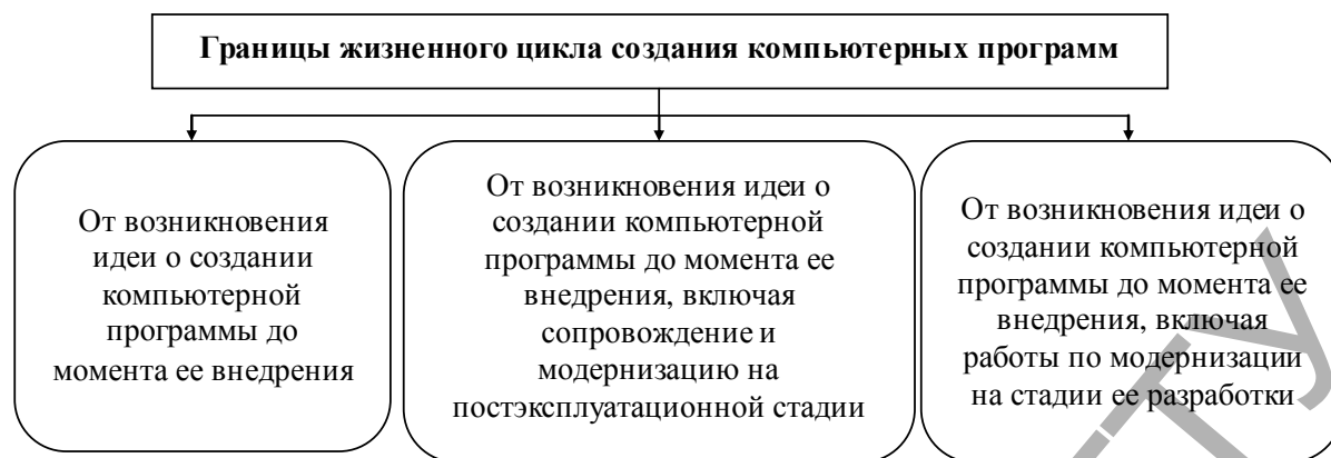
Рис. 1. Границы жизненного цикла создания компьютерных программ

В 3-й версии документа "SWEBOK" (Software Engineering Body of Knowledge) (2014), подготовленного Комитетом по координации программной инженерии (Software Engineering Coordinating Committee) и при активном участии Компьютерного общества IEEE, жизненный цикл создания компьютерных программ включает программные процессы, которые используются для определения и преобразования программных требований к программному продукту, пригодному для поставки [5, с. 151]. Жизненный цикл разработки программного обеспечения начинается с принятия решения о начале реализации программного проекта и заканчивается получением готовой компьютерной программы, пригодной к использованию или реализации на сторону.