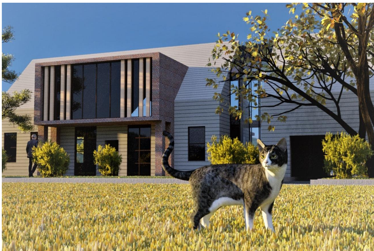
Рисунок 2 – Пример 2 дизайна экстерьера здания в 3Ds Max

В заключение следует отметить, что 3Ds Max является довольно простой по интерфейсу программой, являющейся при этом мощным инструментом для создания фотореалистичных изображений, которые в настоящее время стали неотъемлемой частью не только архитектурного дизайна, но и проектирования вообще. Изображения высокого качества требуют большого комплекса знаний и умений не только в области программного инструментария, но и в теории построения теней, перспективы, цвета. В работе на первоначальном этапе изучения современного ПО для 3D-моделирования и визуализации получены изображения экстерьера и внутренних интерьеров довольно простого здания. Дальнейшее совершенствование в этой теме требует более глубокого изучения теории создания фотореалистичных изображений и будет являться предметом дальнейших исследований.