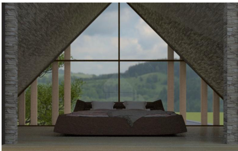
Рисунок 3 – Пример дизайна интерьера в 3Ds Max