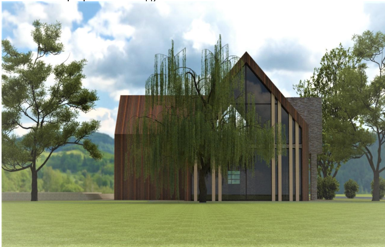
Рисунок 1. – Пример 1 дизайна экстерьера здания в 3Ds Max

В рамках студенческой научной работы мной была разработана трехмерная модель здания в программе SketcUP [1, 3], которая была импортирована в 3Ds Max с целью дизайна экстерьера (рисунки 1 и 2) и внутреннего интерьера зданий (рисунок 3) [2, 4]. Для создания фотореалистичных изображений использовался программный модуль Corona Render .