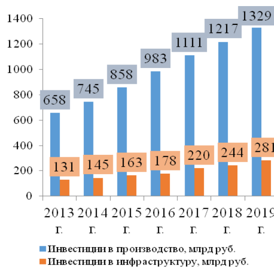
б) динамика инвестиций в Индустриальные парки РФ за 2013-2019 гг.