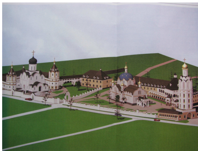
Рис. 4. Вид комплекса Свято-Елизаветинского женского монастыря со стороны жилой застройки [2]

могательных корпусах) подчеркнута их ярусность. В торцах и в точках поворота жилых и хозяйственных корпусов располагаются объёмы с шатровыми завершениями, фасадные плоскости насыщены декором и цветом – парадные крыльца с арками с висячей гирькой, вытянутые бочёнкообразные колонны, вставки и полосы штукатурки другого цвета в обрамлениях оконных и дверных проёмов.