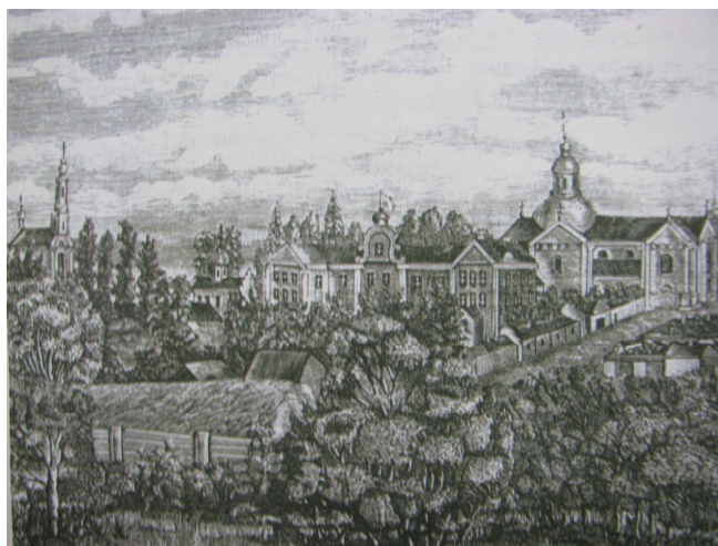
Рис. 1. «Жировицкий Успенский монастырь». Картина неизвестного художника (70-80гг. XIX в.) [1]

В последующем архитектурный комплекс формировался в течение 1672-1825 гг. Первый этап формирования базилианского монастыря связан с именем Иосафата Кунцевича.