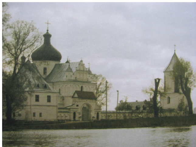
Рис. 3. Вид Свято-Никольского женского монастыря в Могилёве

В настоящее время комплекс имеет исторически сохранный регулярную планировку. Весь комплекс по периметру трапециевидной территории монастыря окружён каменной стеной, декорированной аркатурным поясом. На момент возникновения монастырь имел три входа с брами: северный, южный и северо-западный [4].