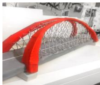
Рисунок 1. Макет арочного пролета Бугринского моста в г. Новосибирске

В первом докладе обращалось внимание на уникальность конструкции моста, рассматривались варианты возведения арочного пролета. Для лучшего понимания особенностей конструкции Бугринского моста был изготовлен его макет (рисунок 1).