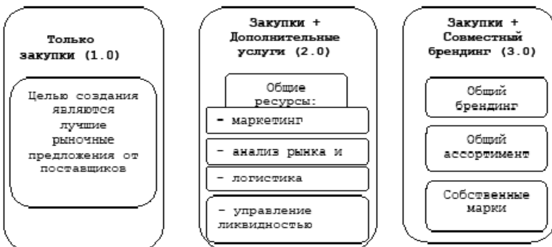
Рисунок 1. Поколения закупочных групп

В настоящее время говорят о наступлении нового этапа развития SCM — электронной цепи поставок (eSC — electronic Supply Chain). Под данным термином понимают группу предприятий, объединенных с помощью компьютерной сети, которая дает им возможность совместно разрабатывать новые продукты, прогнозировать спрос, гибко использовать совместные ресурсы, быстрее реагировать на запросы клиентов [16, с. 22].