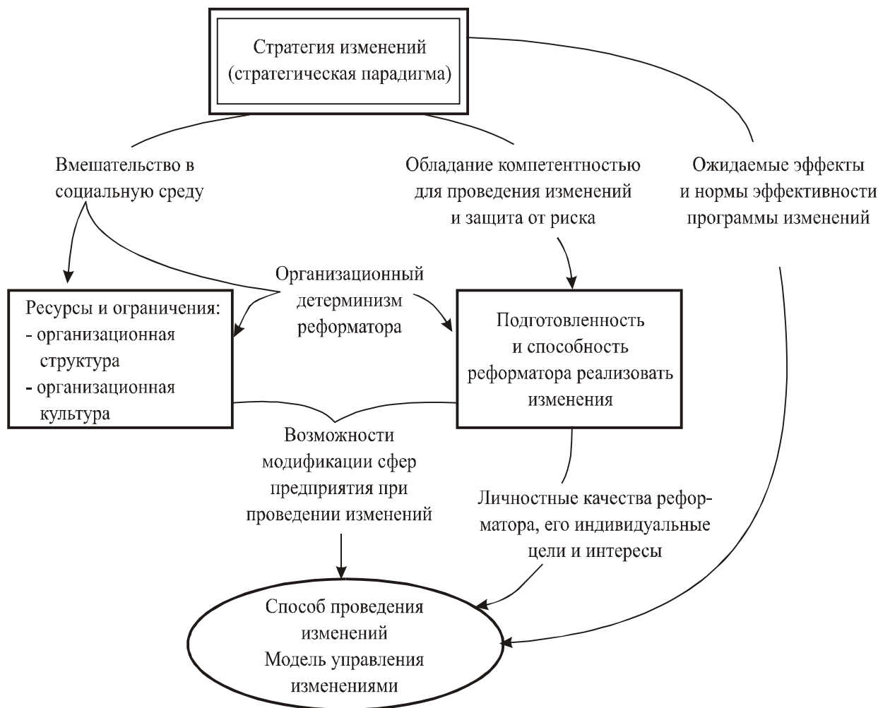
Рис. 2. Стратегические и организационные обусловленности процесса изменений.