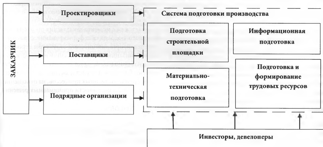
Рисунок 5 Схема взаимоотношений участников инвестиционного процесса на стадии подготовки производства

В реализации строительного проекта может участвовать много различных организаций: проектировщики, подрядчики, поставщики материалов и оборудования, управления механизации, транспортные предприятия, инвесторы, страховые и финансовые структуры, лизинговые компании, девелоперы. Каждая из них имеет свои критерии эффективности деятельности, не всегда совпадающие с целями заказчика и генерального подрядчика. В связи с этим возникает необходимость в наличии предварительно продуманного плана действий, уравновешивающего интересы участников строительства (рисунок 5).