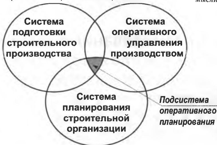
Рисунок 1. Место оперативного планирования.

циональных систем управления строительным производством (рисунок 1).