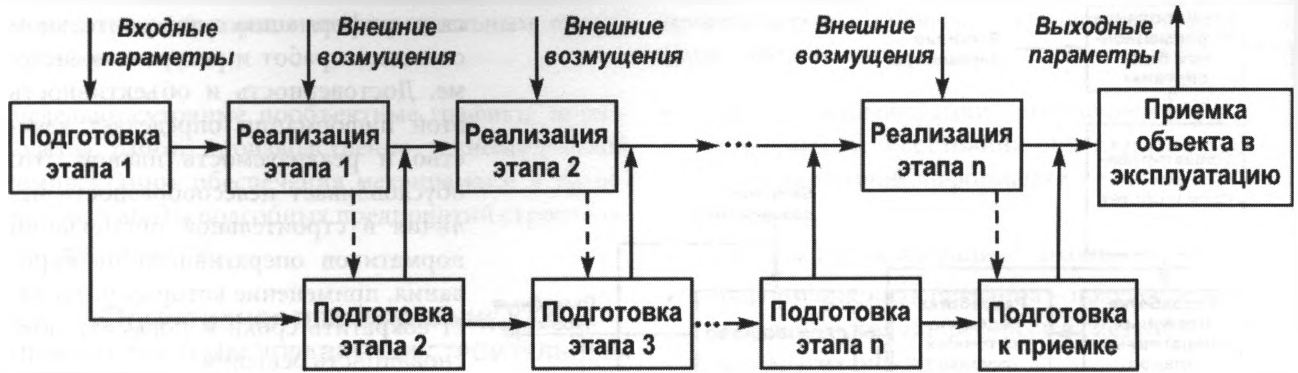
Рисунок 4 Взаимосвязь стадий подготовки и реализации решений по строительству объекта