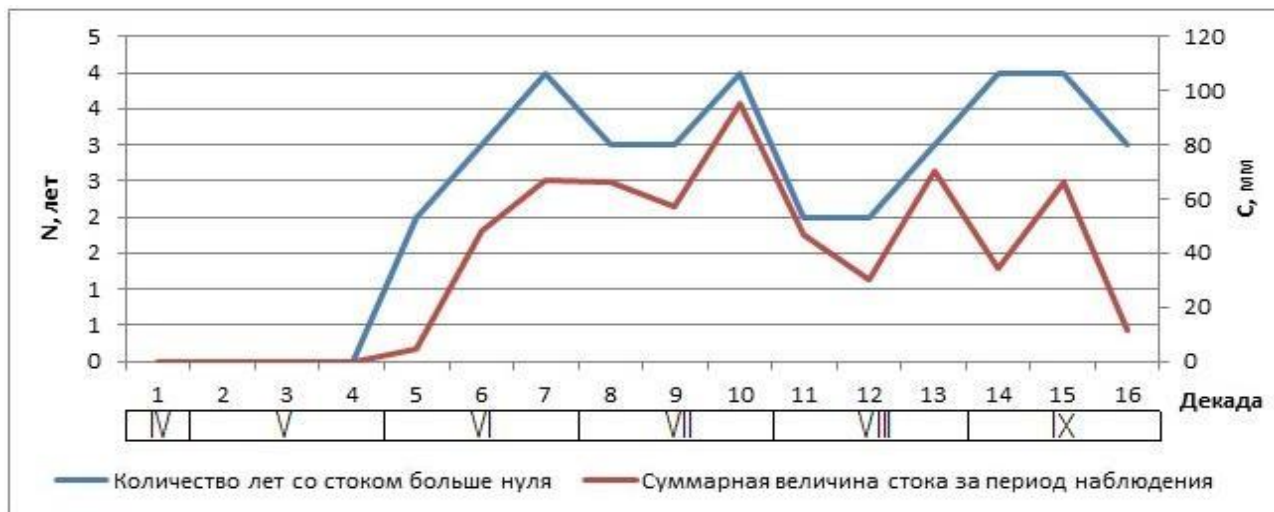
Рисунок 2 – Распределение внутрипочвенного стока по декадам за 1980-2016 гг., вызванного орошением

мая вероятность стока снижается, однако растет его величина. На конец мая и начало июня вероятность стока и его величина также уменьшаются, но резко возрастают к середине июня – началу июля. Минимальное значение стока и число наблюдаемых лет со стоком наблюдается в августе месяце. Рассмотрим распределение внутрипочвенного стока вызванного только орошением, рисунок 2.