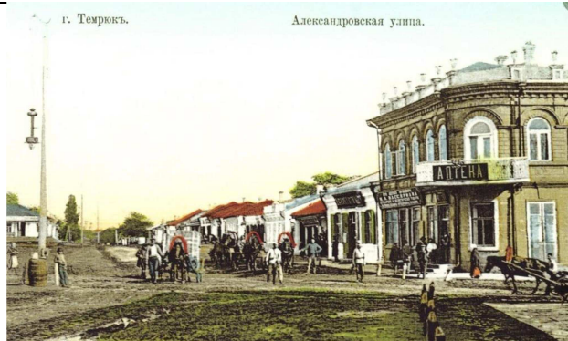
Рисунок 2 – Темрюк. Центральная ул. Александровская (ныне ул. Ленина). 1901 г.