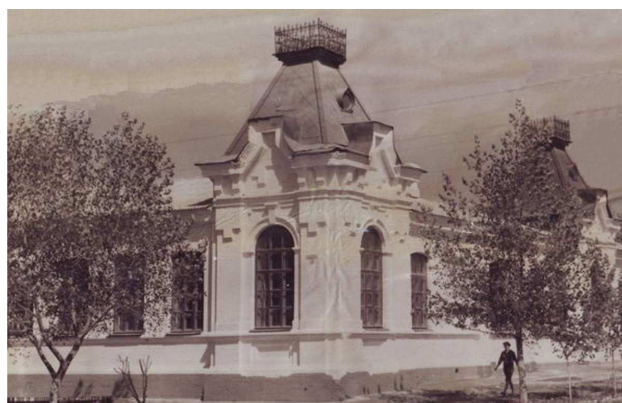
Рисунок 5 – Темрюк. Здание бывшего 2-классного женского училища на улице Дворянской (Октябрьской), в котором в начале XX в. размещалась городская публичная библиотека (сейчас здание школы № 14) Фотография первой половины XX в.