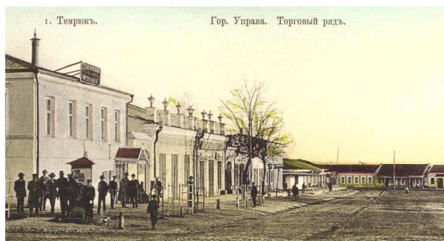
Рисунок 3 – Темрюк. Городская управа и торговые ряды. Начало XX в.

Городские власти уделяли должное внимание образованию. В центральной части располагались здания Реального училища, 2-классного женского училища (рис. 4–5) и др. учебные заведения.