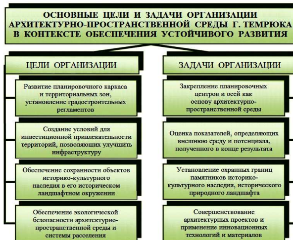
Рисунок 7 – Основные цели и задачи организации архитектурно-пространственной среды г. Темрюка в контексте обеспечения устойчивого развития