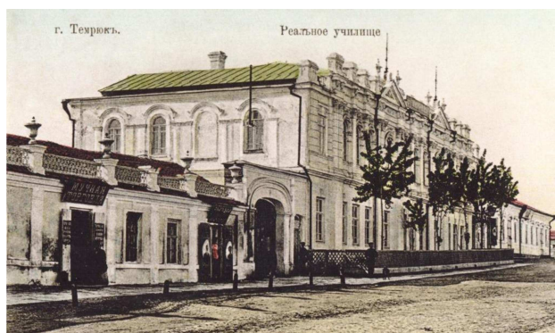
Рисунок 4 – Темрюк. Реальное училище до 1917 г. Издатели: Темрюк. 1917 г. Издание книжн. маг. Карпузи А. Д.

Городские власти уделяли должное внимание образованию. В центральной части располагались здания Реального училища, 2-классного женского училища (рис. 4–5) и др. учебные заведения.