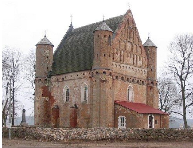
Рис. 1. Церковь оборонного типа в деревне Сынковичи

городской площади (рис. 2). На главном фасаде церкви, выполненном в виде своеобразного щита, прикрывающего объём здания, собраны в единую и выразительную художественную композицию формы и детали архитектуры барокко.