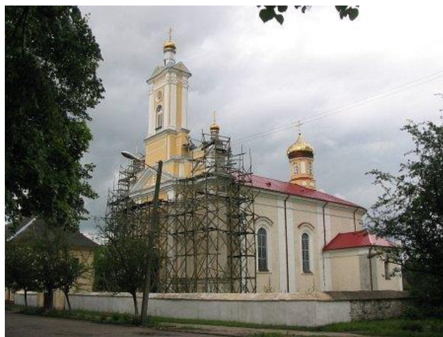
Рис. 2. Петропавловская церковь в г. Ружаны

После 1596 г., даты заключения Брестской унии, количество православных храмов начало резко сокращаться. С начала XVII века униатское духовенство при поддержке власти Великого Княжества Литовского проводит жесткую политику вытеснения православной веры и перестройки православных храмов. Согласно имеющимся данным, в 1621 г., спустя 25 лет после заключения унии, перестали действовать 2169 православных церквей [1, с. 205]. Вместе с тем в качестве примера единичного строительства православных церквей можно назвать Петропавловскую церковь в г. Минске (1620–1630 гг.). В её архитектуре заметно влияние католического храмостроительства. Основной объём церкви – трехнефная, шестиколонная базилика без трансепта. Одна