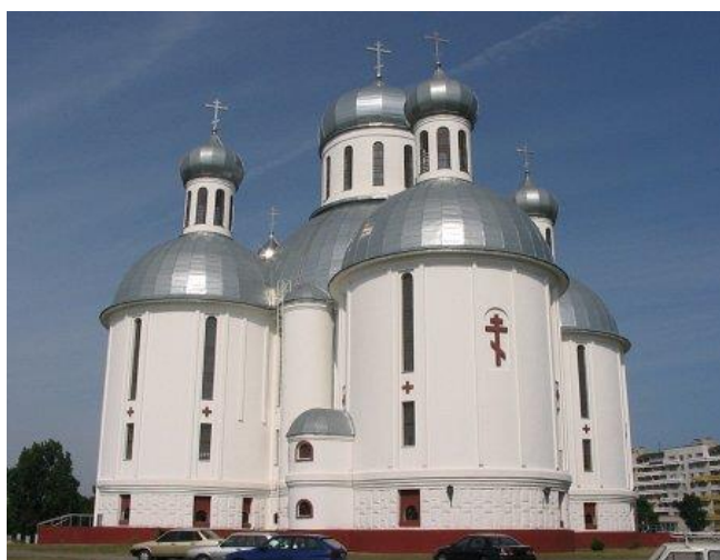
Рис. 6. Свято-Воскресенский собор в г. Бресте

Таким же градостроительным акцентом микрорайона «Восток» в г. Бресте является Свято-Воскресенский собор, завершающий застройку ул. Московской (рис. 6).