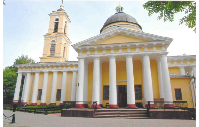
Рис. 3. Петропавловский собор в г. Гомеле

Длительный период упадка и почти полного отсутствия культового строительства со второго десятилетия XX века почти до конца XX не оставил исследователям материалов для анализа.