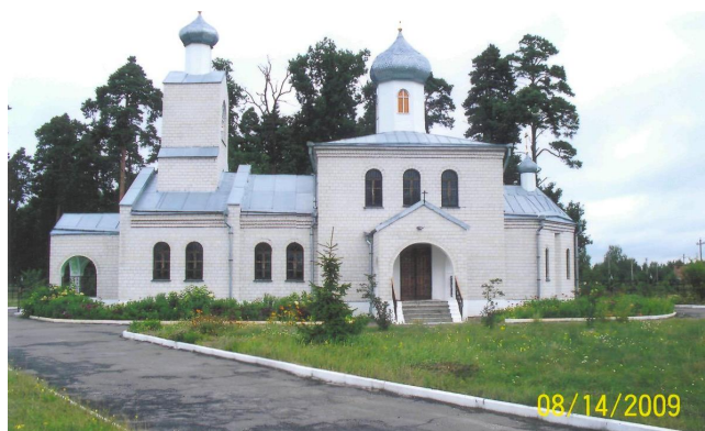
Рис. 7. Церковь Великомученика Георгия Победоносца в агрогородке Белое Болото Речицкого района

В качестве примера можно показать каменную церковь в агрогородке Белое Болото Речицкого района. Церковь Великомученика Георгия Победоносца размещена на окраине агрогородка, является архитектурным акцентом главной улицы (рис. 7). Здание продольно-осевой композиции выполнено из силикатного кирпича. Основной объем здания завершается высоким барабаном, покрытым шлемоподобным куполом. Над приходом возвышается колокольня, завершаемая главкой небольшого размера. Еще меньшая главка завершает покрытие апсиды. Скромное по архитектуре здание церкви прекрасно вписывается в природное окружение и является украшением сельского населенного пункта.