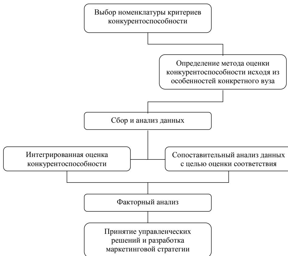
Рис. 2. Этапы оценки конкурентоспособности вуза

Вуз может проводить оценку своей конкурентоспособности в той нише рынка, в которой он функционирует, оценивая свое положение по отношению к конкурентам. Оценка необходимо проводить в комплексе по различным критериям, включая анализ слабых и сильных сторон. Этапы оценки конкурентоспособности вуза приведены на рис. 2.