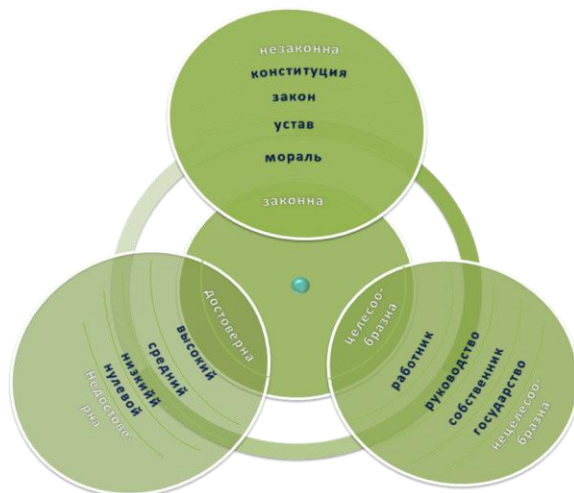
Рисунок 3 – Классификация хозяйственных операций [3]

Каждому из представленных здесь нарушений соответствует определенный вид ответственности, а, следовательно, и применяемых санкций.