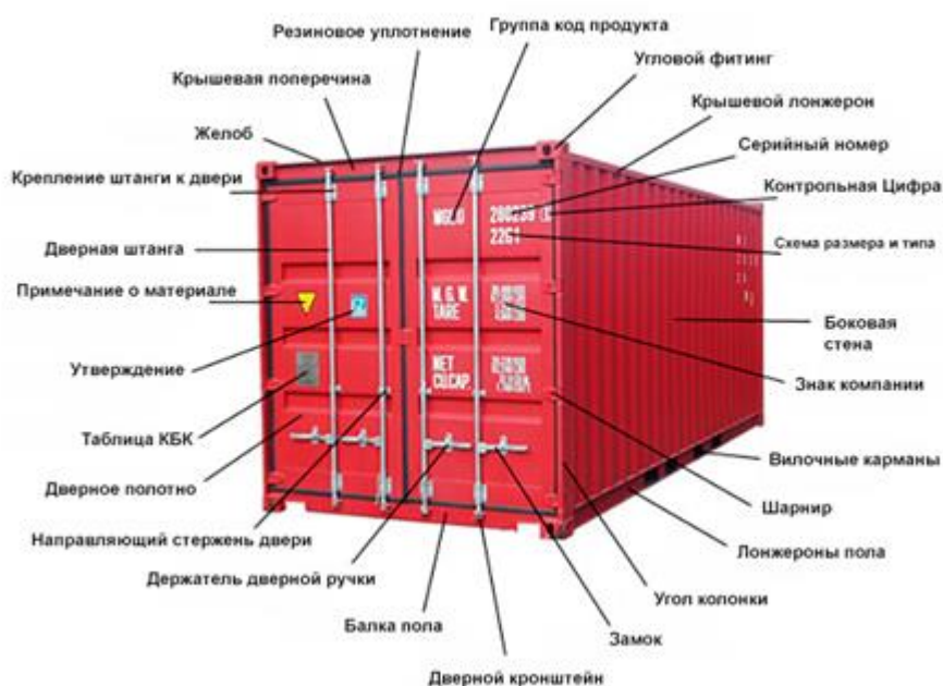
Рисунок 3.1. Контейнер-клетка