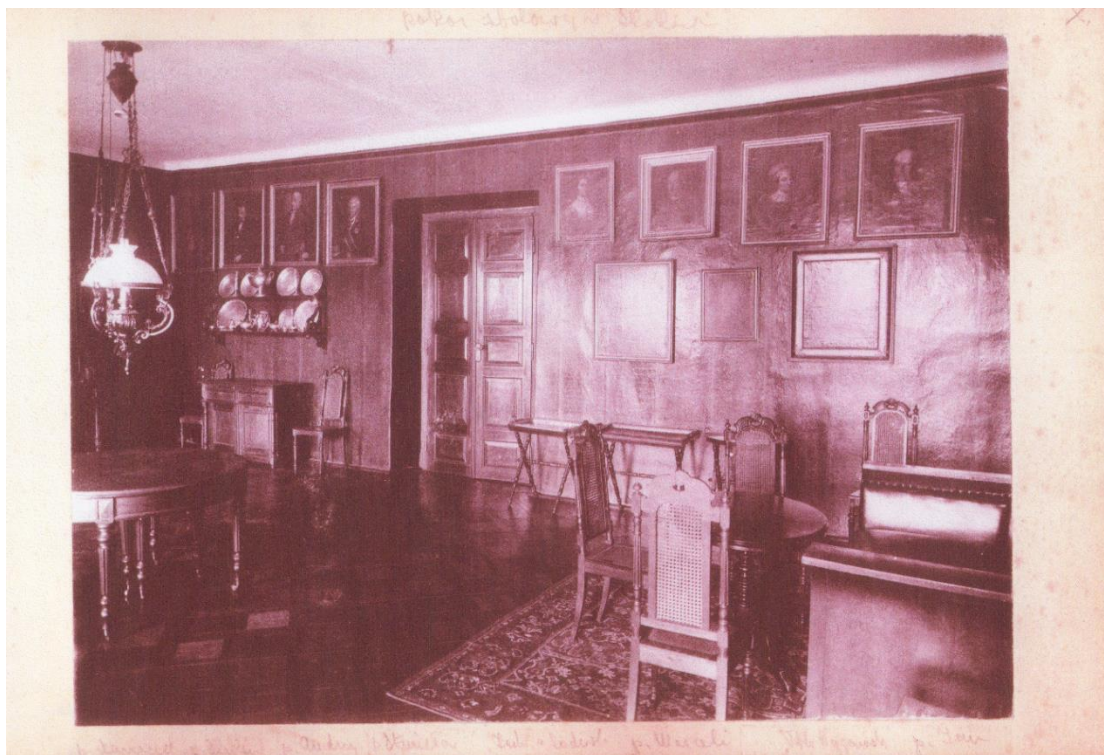
Рисунок 2 – Скоки. Усадьба Немцевичей. Салон первого этажа (начало XX века)

который сегодня является одним из знаковых исторических объектов Брестчины. Музей позиционируется, прежде всего, как интерьерный музей. Здесь можно увидеть интерьеры XVIII–XIX века: гостинную, балльный зал, оружейную, музыкальный салон и др. [6]. Изображения интерьеров дворца, введенные в научный оборот А. А. Гладыщуком [7] (рисунки 2–4), а также сохранившиеся аутентичные элементы интерьеров позволили воссоздать обстановку и атмосферу этого уникального объекта (рисунки 5–7).