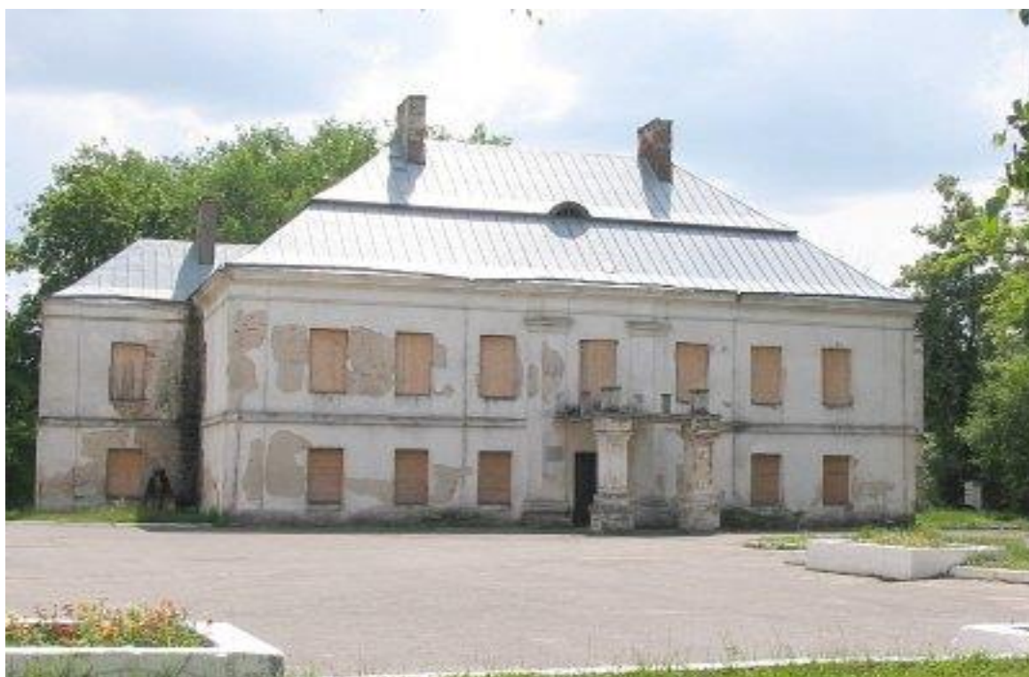
Рисунок 1 – Скоки. Вид дворца в начале XXI века до начала реставрации