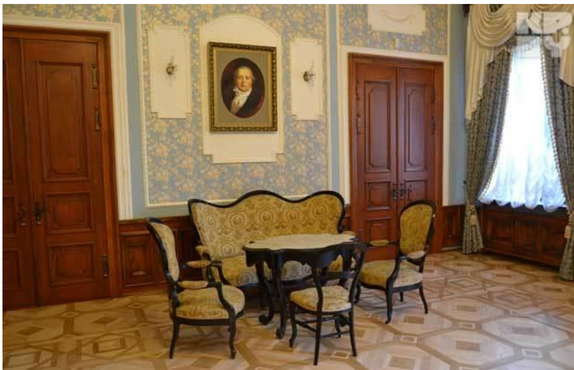
Рисунок 6 – Скоки. Усадьба Немцевичей. Фрагменты интерьера салона второго этажа (2018 г.)