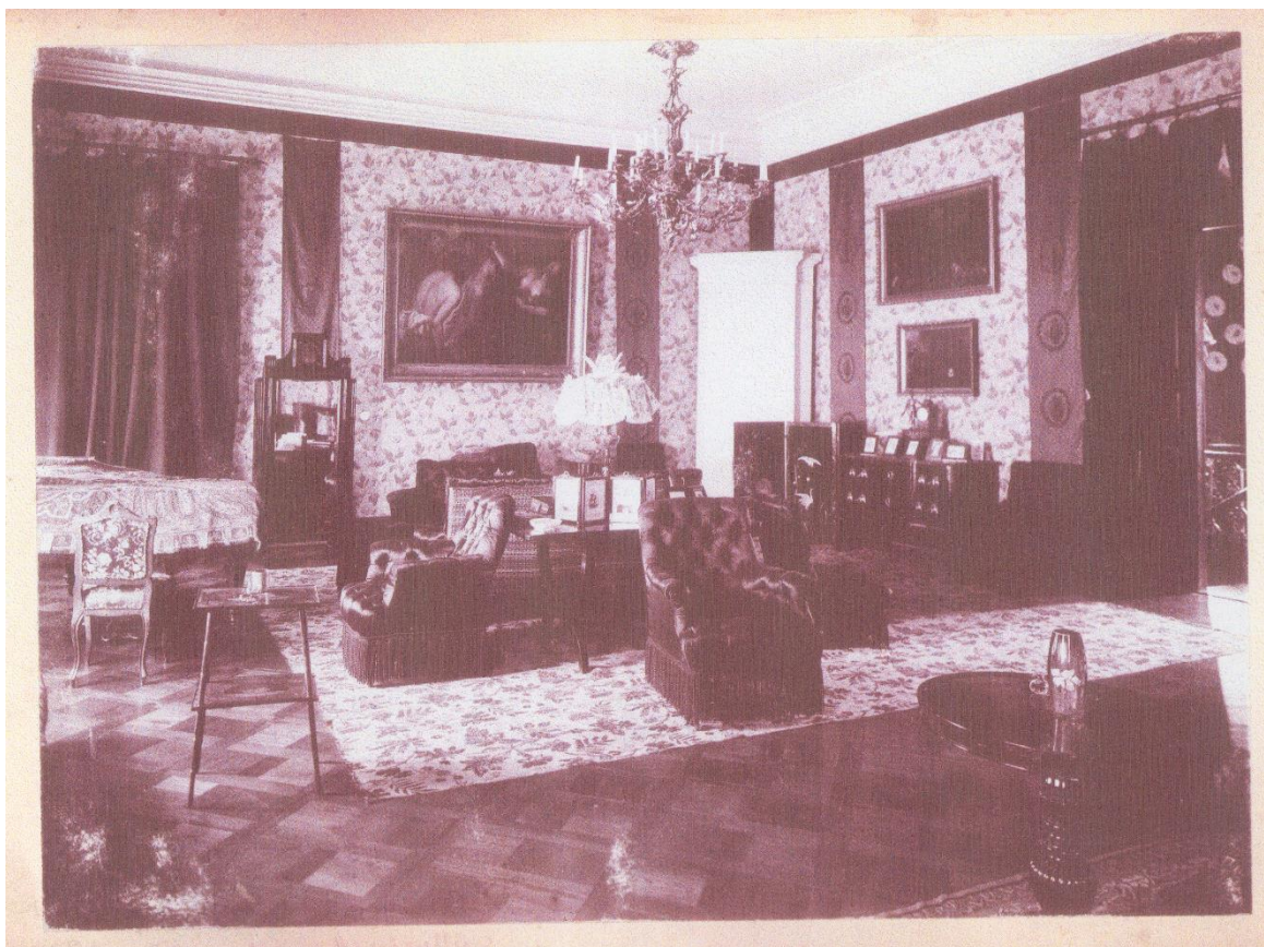
Рисунок 4 – Скоки. Усадьба Немцевичей. Салон второго этажа (начало XX века)