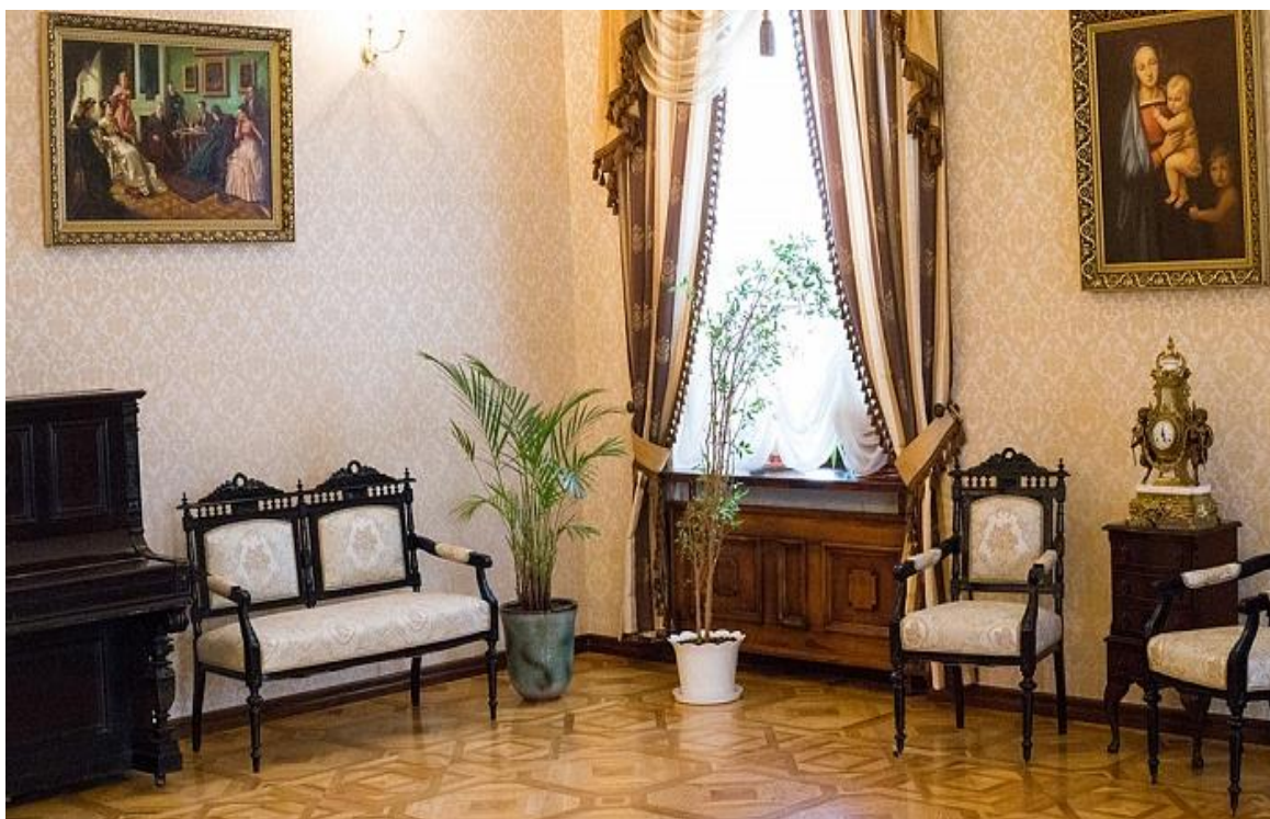
Рисунок 5 – Скоки. Усадьба Немцевичей. Фрагменты интерьера салона второго этажа (2018 г.)