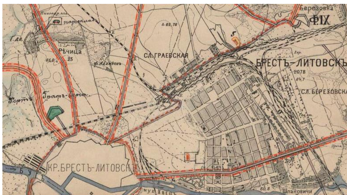
Рисунок 1 – Фрагмент плана «Проект развития Брест-Литовской крепости», 1907 г.