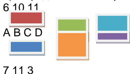
Рисунок3 - Эпюры грузопотоков

6) определить категорию транспортных коммуникаций, т.е. дорог.