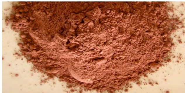
Рисунок 2 – Керамзитная пыль ЗАО «Лидский завод керамзитового гравия»

Керамзитная пыль – побочный мелкодисперсный материал при получении керамзитных гранул во время высокотемпературной обработки в печах. Ежегодно образуется порядка 3 тыс. т (рисунок 2), что свидетельствует о крупнотоннажном отходе в Республике Беларусь, учитывая период производительности комплекса. Цвет может быть от насыщенно коричневого до красно-коричневого, насыпная плотность отхода 1200–1400 кг/м 3 , удельная поверхность – 700–850 м 2 /кг. Отход относится к 4 классу опасности. Химический состав представлен в таблице 3.