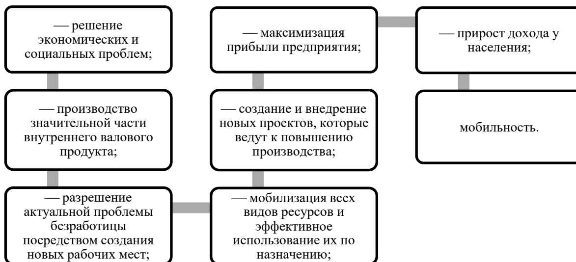
Рисунок 1 – Положительные моменты осуществления государственной помощи предприятиям малого и среднего бизнеса

Малое и среднее предпринимательство в Республике Беларусь имеет важное значение для экономики, поскольку оно способствует созданию рабочих мест, развитию инноваций и повышению конкурентоспособности бизнес-сектора. Понимая это, правительство Республики Беларусь в последние годы предпринимает широкие шаги для стимулирования развития малого и среднего предпринимательства (МСП), включая упрощение процедуры регистрации бизнеса, снижение налоговых ставок и предоставление финансовых гарантий для предпринимателей [1]. На сегодня малый и средний бизнес как приоритетная задача государства включает в себя множество положительных моментов (рисунок 1).