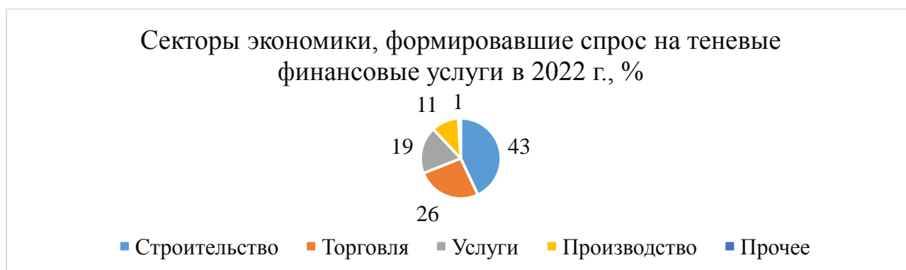
Рисунок 2 – Секторы экономики, формировавшие спрос на теневые финансовые услуги в 2022 г., % [7]

Центральный банк России сообщил, что объем подозрительных операций в банковском секторе снизился на 5 % в 2022 году (рисунок 2).