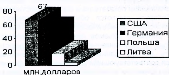
Рис. 1. Основные страны, ввозящие капитал в Республику Беларусь

В 2000 году республикой фактически получено иностранных кредитов под гарантии Правительства Республики Беларусь на сумму 152,97 млн. долл. США, что в 2,6 раза больше, чем за 1999 год (59,38 млн. долл. США).