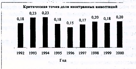
Рис. 3. Критическая точка доли иностранных инвестиций в инвестиционном потенциале РБ

В качестве результативного признака (y) выступает рост инвестиционного потенциала РБ, факторными являются объемы привлекаемых внутренних ( x_1 ) и иностранных инвестиций ( x_2 ). Приведенные показатели свидетельствуют о том, что влияние совокупного капитала оценивается в пределах 69%, при этом преобладающее воздействие на развитие инвестиционного потенциала в период с 1992 по 2001 год оказывалось со стороны внутреннего капитала в размере 67% ( \gamma_y при этом равно 100%) и 31% со стороны иностранного, при этом, критическая точка влияния иностранных инвестиций на потенциал страны приходилась на 1996 г. (рис. 3.).