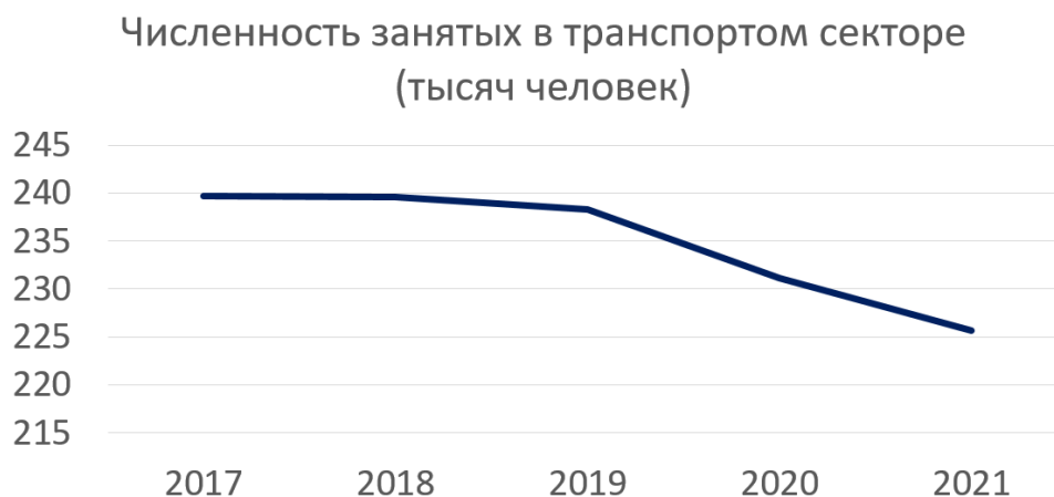
Рисунок 1 – Численность занятых с транспортом секторе

Численность занятых в транспорте секторе Беларуси в 2021 году составила 225,7 тысяч человек. Из них деятельностью сухопутного и трубопроводного транспорта составляет 176,2 тысячи человек, деятельность водного транспорта составляет 0,5 тысячи человек, деятельность воздушного транспорта – 2,3 тысячи человек и складирование и вспомогательная деятельность 46,7 тысячи человек. Относительно 2020г. численность повысилась на 19,6 тысячи человек.