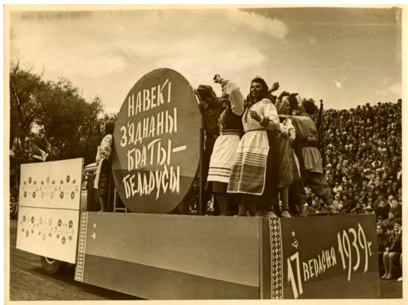
Фота 4 – Святкаванне 950-годдзя г. Брэста. 1969 г. Фотаняпера. Фотадрук чорна-белы. КП 614/17

Падчас мерапрыемства была паказана таксама платформа, якая сімвалізавала абаронцаў Брэсцкай крэпасці. На платформе знаходзілася выява сцяны, групы акцёраў, а таксама надпіс “Умираю, но не сдаюсь! Прощай Родина!” [12]. На здымках паказаны платформы, прысвечаныя перыяду нямецка-фашысцкай акупацыі і партызанскай барацьбы. На адной з іх была выява гарадскога будынку, афішнай тумбы і вялікі плакат з надпісам “Граждане г. Бреста! Вставайте все на борьбу с немецко-фашистскими захватчиками. Смерть немецким оккупантам!” [13].