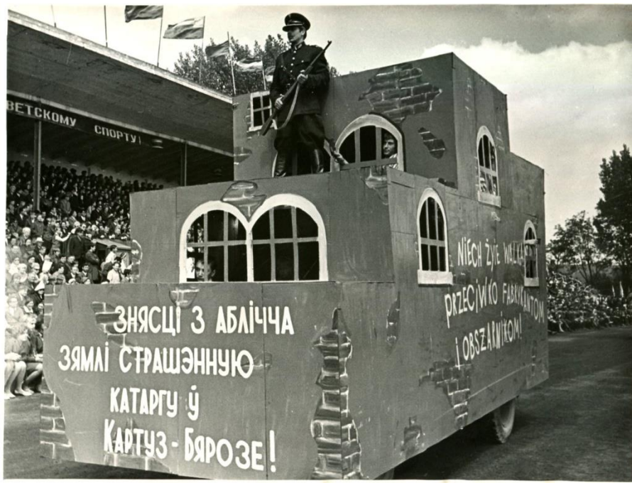
Фота 3 – Святкаванне 950-годдзя г. Брэста. 1969 г. Фотапапера. Фотадрук чорна-белы. КП 614/08

Таксама частка акцёраў у касцюмах дружыннікаў была вярхом на конях і са стылізаваным рыштункам. Часы барацьбы з крыжакамі адлюстраваны толькі на адным фотаздымку. Верагодна, што на платформе знаходзілася інсталяцыя ў выглядзе Камянецкай вежы (на здымку бачна толькі частка канструкцыі). Побач з ёй на кані перад глядачамі на стадыёне гарцаваў акцёр у касцюме крыжака [8]. Падзеі Кастрычніцкай рэвалюцыі паказвалі акцёры ў форме чырвонаармейцаў. Асобная платформа была прысвечана заключэнню Брэсцкага міру ў 1918 г. На стылізаванай сцяне былі змешчаны плакаты з надпісамі “Брестский мир”, “Долой войну”, “Всем, всем, всем”. На здымку таксама бачныя постаці акцёраў, якія ігралі салдатаў [9]. Адлюстраваннем перыяду знаходжання заходнебеларускіх земляў у складзе Польшчы была механізаваная платформа са стылізаванай выявай канцэнтрацыйнага лагера ў Бярозе Картузскай. Унутры канструкцыі знаходзіліся акцёры, якія гралі вязняў лагера, а на версе – акцёр у форме польскага ахоўніка са зброяй. Звонку на канструкцыі былі надпісы “Знесці з аблічча зямлі страшэнную катаргу ў Картуз-Бярозе!” і “Niech żyje walka przeciwno fabrykantom i obszarnikom!” (“Няхай жыве барацьба супраць фабрыкантаў і памешчыкаў!”) (фота 3) [10].