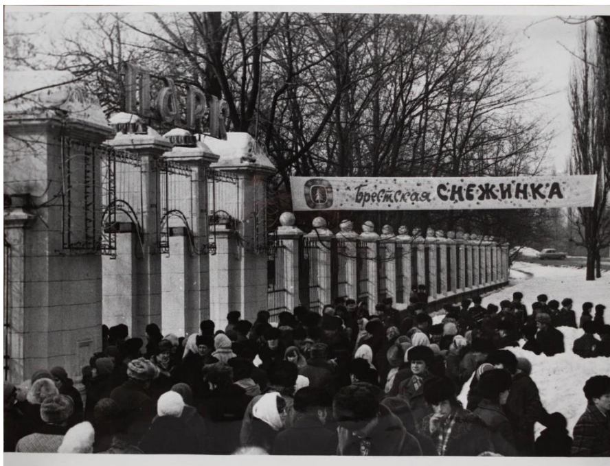
Фота 10 – Свята “Брэсцкая сняжынка-79”. 1979 г. Фотапапера. Фотадрук чорна-белы. КП 773/04

У 1979 годзе ў Брэсце адбылося свята “Брэсцкая сняжынка-79”. Яно мела масавы забаўляльны характар і праходзіла на тэрыторыі гарадскога парка. На васьмі здымках адлюстраваны праезд механізаваных платформ з Дзедам Марозам, Снягуркай, іншымі міфалагічнымі і фальклёрнымі персанажамі да парка, прадстаўленне на эстрадзе, народныя гулянні (фота 10) [29].