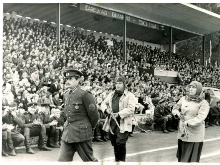
Фота 5 – Святкаванне 950-годдзя г. Брэста. 1969 г. Фотаняпера. Фотадрук чорна-белы. КП 614/01

На іншай платформе была паказана сцэна з падзеяў “рэйкавай вайны” [14]. На адным са здымкаў таксама можна пабачыць сцэну з жыцця партызанаў: узброеныя мужчына і жанчына канваіруюць афіцэра ў нямецкай форме (фота 5) [15]. Асобная платформа была прысвечана падзеям Вялікай Перамогі ў 1945 г. На ёй была змешчана вялікая выява медалю (аверс і рэверс) “За перамогу над Германіяй у Вялікай Айчыннай вайне 1941-1945 гг.”, чырвоныя зоркі і чырвоны сцяг [16].