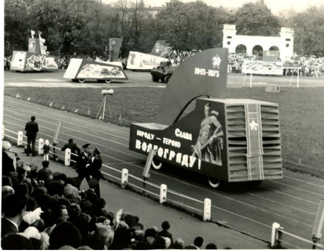
Фота 8 – Свята Перамогі ў Брэсце. 1979 г. Фотаняпера. Фотадрук чорна-белы. КП 615/14

У 1977 годзе таксама быў зроблены здымак скульптурнай кампазіцыі “Кніга Гонару” у брэсцкім гарадскім парку [25].