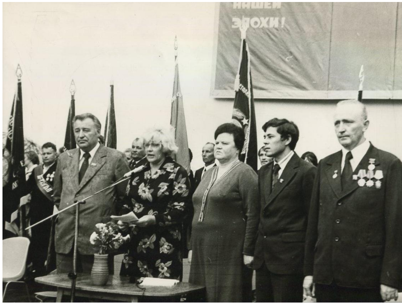
Фота 9 – Свята працоўнага рапарта чыгуначніка ў Брэсце. 1979 г. Фотапапера. Фотадрук чорна-белы. КП 771/04

У 1979 годзе ў Брэсце адбылося свята “Брэсцкая сняжынка-79”. Яно мела масавы забаўляльны характар і праходзіла на тэрыторыі гарадскога парка. На васьмі здымках адлюстраваны праезд механізаваных платформ з Дзедам Марозам, Снягуркай, іншымі міфалагічнымі і фальклёрнымі персанажамі да парка, прадстаўленне на эстрадзе, народныя гулянні (фота 10) [29].