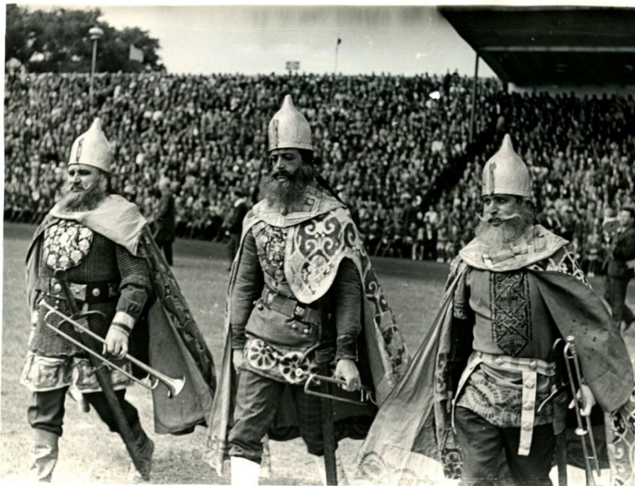
Фота 1 – Святкаванне 950-годдзя г. Брэста. 1969 г. Фотапапера. Фотадрук чорна-белы. КП 614/19

На здымках можна пабачыць асноўныя механізаваныя платформы, якія выкарыстоўваліся падчас мерапрыемства, а таксама групы акцёраў. Гэтыя элементы прадстаўлення сімвалізавалі канкрэтныя гістарычныя падзеі ці этапы развіцця горада. Старажытнарускі перыяд быў прадстаўлены групай акцёраў, апранутых у стылізаваныя касцюмы княскіх дружыннікаў. На здымку бачна, што гэта былі ўдзельнікі ансамбля духавых інструментаў (у руках яны мелі трубы) (фота 1) [6].