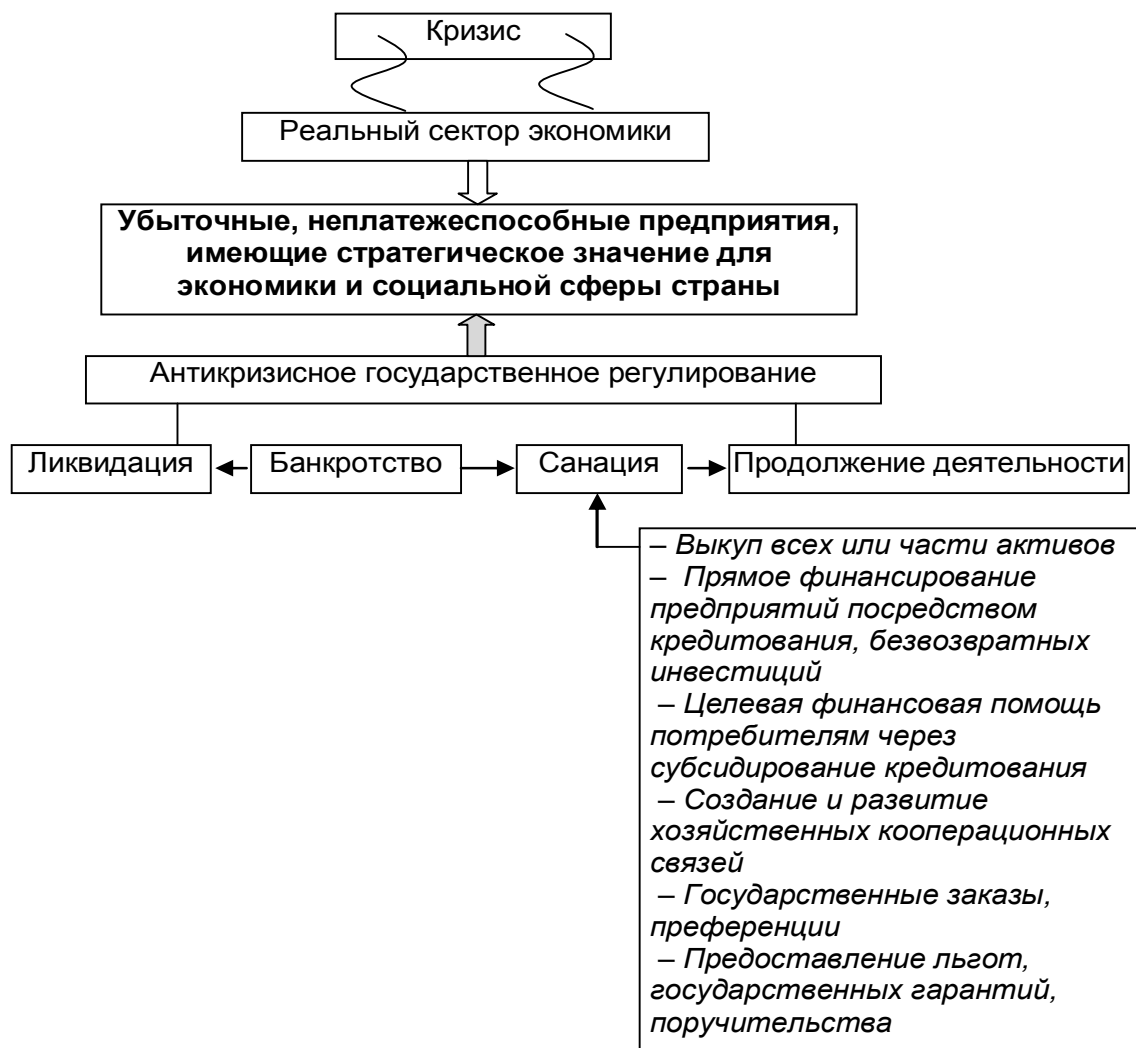
Рис. 1. Антикризисное государственное регулирование предприятий реального сектора экономики

Для сокращения числа неплатежеспособных предприятий государством разрабатываются антикризисные программы, в том числе включающие меры по финансированию реального сектора экономики (рис. 1).