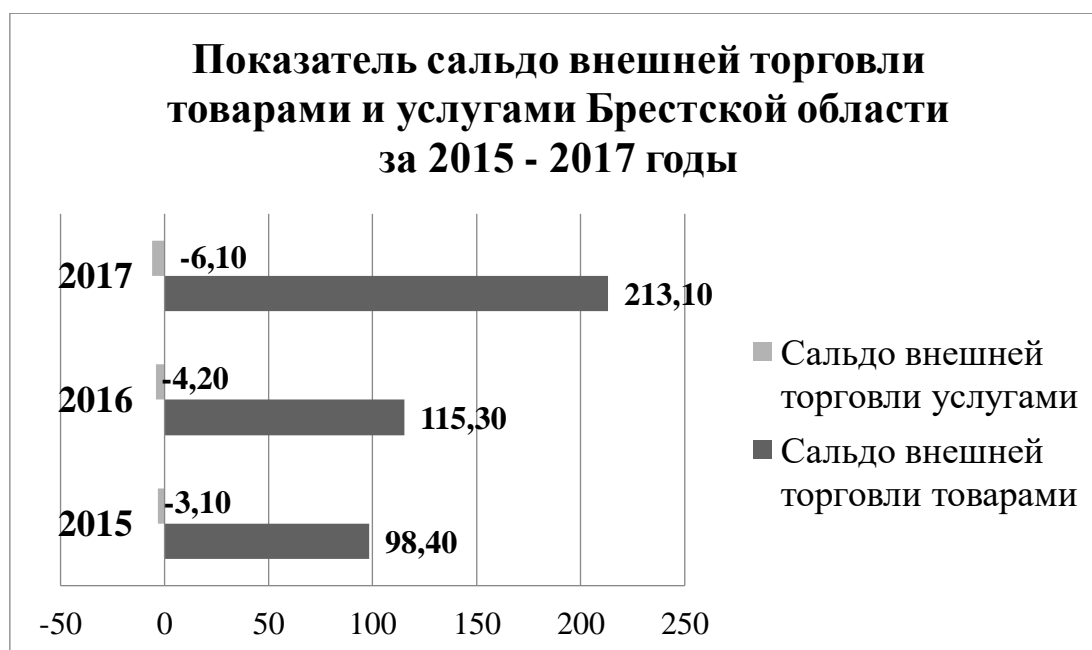
Рисунок 3 – Сальдо внешней торговли товарами и услугами, в миллионах долларов США, Брестской области за 2016 – 2017 годы

Из данной статистики можно сделать вывод, функционирование свободных экономических зон благоприятно влияет на показатель сальдо внешней торговли товарами как в Брестской области так в целом по Республике Беларусь, что способствует укреплению внешнеэкономических связей. Но показатель сальдо внешней торговли услугами с каждым годом значительно снижается, что влияет негативно на общие показатели внешней торговли услугами и требует обязательных мер для улучшения данного показателя.