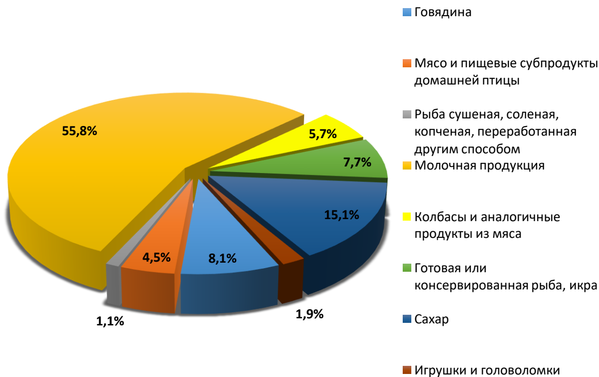
Рисунок 2 – Экспорт важнейших видов продукции Брестского региона 2019 г., %

Крупнейшими товарными позициями экспорта Брестского региона традиционно являются продукты питания: мясо, колбасы, консервированная рыба и морепродукты, молоко и молочная продукция. Кроме того, предприятия области экспортируют печи, мебель, детские игрушки, одежду, плиты для мощения, лампы накаливания (рисунок 2).