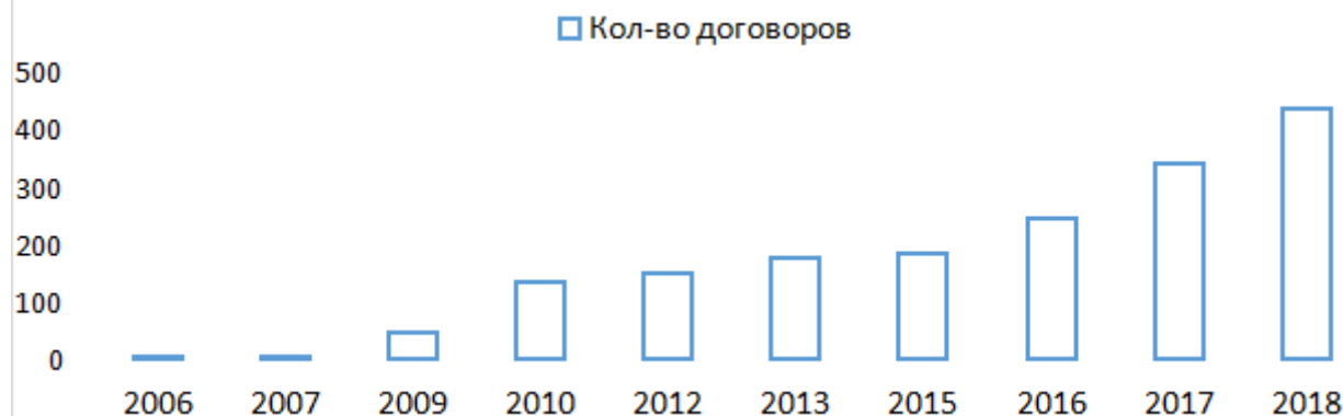
Рисунок 2 – Развитие франчайзинга в Республике Беларусь

Ежегодно количество договоров растет на 15–17%. В 2015 году было подписано 187 договоров, 2016 г. – 247, 2017 г. – 342 и в 2018 г. – 438 (рисунок 2).