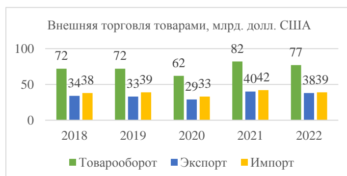
Рисунок 2 – Внешняя торговля товарами, млрд. долл. США [5]

Республика Беларусь осуществляет многовекторную внешнеэкономическую политику и активно участвует в международных интеграционных процессах. Беларусь является экспортоориентированным государством с развитой промышленностью и сельским хозяйством (рис.2).