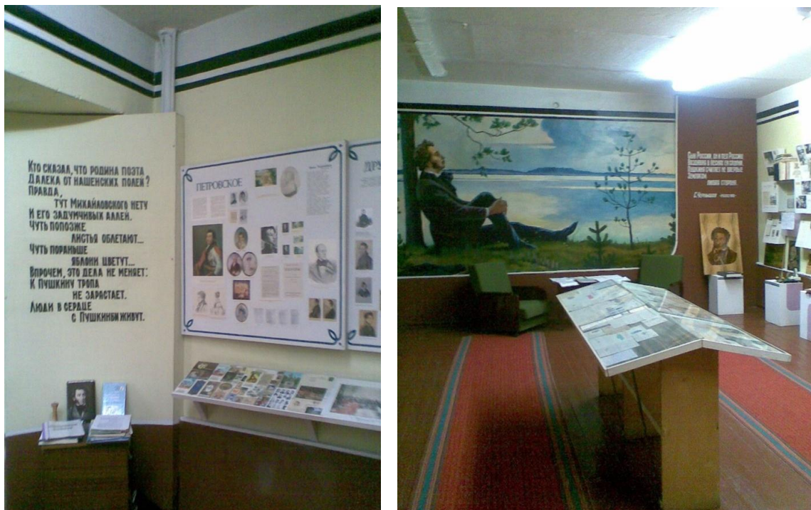
Фото 2, 3. В музее А.С. Пушкина

содержат уникальные издания и документы, в том числе и материалы поисковой деятельности школьников [2, с. 16-19].