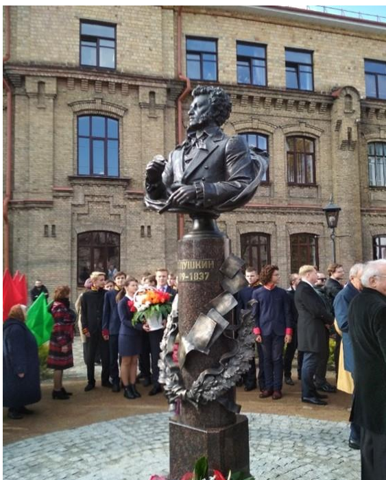
Фото 6. Открытие памятника в Бресте 11 октября 2019 г.

Экскурсия для учащихся – это главным образом лекция о жизни и творчестве поэта с привлечением музейной экспозиции в качестве наглядного материала. В таком виде экскурсия приобретает важное образовательное значение и способствует углубленному изучению литературы, помогает учащимся развивать творческие способности. Пушкинское творчество и сегодня оказывает влияние на жизненную активность ореховских пушкинистов. К празднику пушкинской поэзии, к Неделе русского языка и литературы, ко Дню памяти А. С. Пушкина готовятся выставки рисунков, поделок, сочинений, связанных с пушкинской тематикой (фото 6, 7).