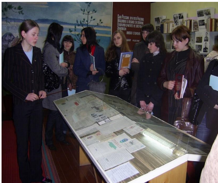
Фото 7. Белорусские студенты в музее Пушкина, 2011 г.

В таких мероприятиях участвуют школьники и учителя из разных регионов Беларуси и России, что свидетельствует о единстве культурных, эстетических и нравственных ценностей двух народов.