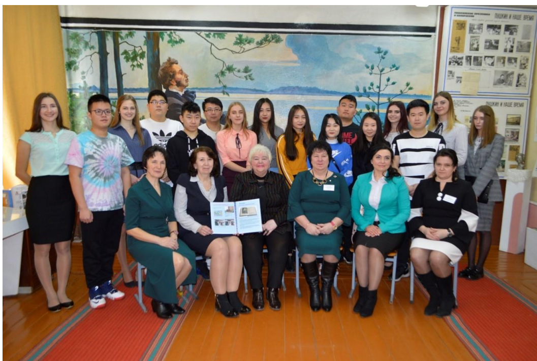
Фото 5. Китайские и белорусские студенты на экскурсии в музее

Все это свидетельствует о разнообразной поисковой работе школьников, об их интересе к творчеству русского поэта. Такие материалы приобщают учащихся к эпохе, к миру человеческих отношений, потому что экспозицию мы рассматриваем и как средство наглядности, основанное на поисковых материалах школьников, и как средство, рождающее живое восприятие учебно-наглядного материала, помогающее формировать представление о личности А. С. Пушкина, его эпохе и творчестве ( фото 5 ).